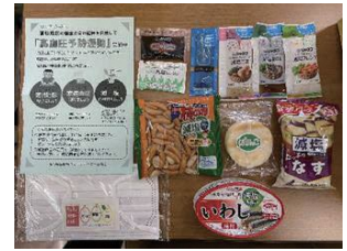
巡回複合健診での配布物

高杉地区は、健（検）診 PR 活動に力を入れて活動しました。主な健（検）診 PR 活動は、地区の施設 3 か所（市の公共施設・スーパー・郵便局）へポスターの掲示、チラシの回覧等の他、巡回複合健診当日に、受診者へ粗品の配布（減塩商品の詰め合わせ）や次年度の健診受診勧奨を行いました。