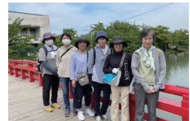
弘前公園でのウォーキング

時敏地区は、町会の健康講座や夏まつりなどの機会に、健（検）診や高血圧予防に関するPR活動を行いました。コロナ禍ですが、定例会(年3～4回開催)などのできる活動を考え、例年から活動内容を変更しながら実施しました。今後も、時敏地区の健康づくりを頑張っていきたいです。