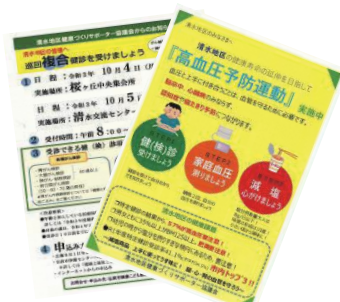
健(検)診受診 PR と 高血圧予防運動チラシ

清水地区は、健康課題である高血圧予防対策として、小学校の児童・保護者などの若い世代に対するアプローチはコロナ禍で実施できませんでしたが、できる活動として、高血圧の実態及び予防についてのチラシを毎戸に配布し、また町内の掲示板にも掲示して、広く地区の皆さんに対する普及啓発に力を入れて活動しました。