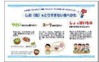
千年小学校健康づくり PR 活動で配付した教材（一部抜粋）

千年地区は、これまでイベント等での健康づくりや健（検）診受診 PR 活動を実施してきましたが、新型コロナウイルス感染症の影響で、参加していたイベントが中止となり、活動機会が減少しました。その中でもできる活動を考え、健康づくりに関する PR チラシを毎戸配布したり、千年小学校のこどもたちに減塩の大切さを伝えるなど、地域のみなさんに健康づくりのメッセージを届ける活動を工夫しました。