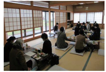
第一中学校区の健康づくりサポーター茶話会の様子

和徳学区では、今年度新たに、第一中学校区の健康づくりサポーターで茶話会を開きました。コロナ禍で活動が難しい状況にありますが、改めてサポーター活動を振り返り、考える機会となっています。