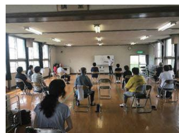
いきいきサロンの様子

和徳地区は、保健衛生委員と共催で実施した「いきいきサロン」で、健康運動指導士の方を講師に運動を実施しました。 また、第一中学校区の健康づくりサポーターで茶話会を行い、近隣の地区の方と意見を交換し、今後の活動について話し合いを行いました。コロナ禍で中止となった活動もありますが、できる活動から実施し、和徳地区の健康づくり活動を継続していきたいです。