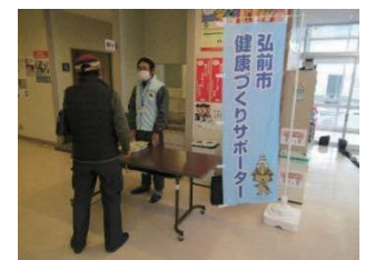
新和地区複合健診での活動

新和地区では、健（検）診受診率向上のため、健（検）診受診の PR チラシを作成し、各町会に配布しました。複合健診の当日には、健（検）診受診者に対して、血圧手帳や高血圧予防に関するチラシを配布し、健康づくりに関する知識の普及啓発を行いました。新型コロナウイルス感染症の影響で、実施できる活動に制限がありますが、状況に合わせて活動を工夫していきたいです。