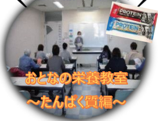
おとなの栄養教室 ～たんぱく質編～