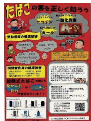
掲示したポスター

石川地区は、これまで公民館まつり等で健康づくり活動を実施してきましたが、新型コロナウイルス感染症の影響で、活動機会が減少しました。対面での活動が難しい中で、公民館や石川小中学校に健康づくりに関するポスターを掲示してもらおう等、工夫して活動を実施しました。