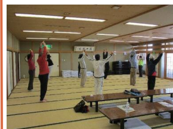
ひろさき健幸増進リーダーによる体操の様子

豊田地区は、健康づくりサポーターの活動について PR するため、チラシを作成し豊田地区町会に回覧しました。また、豊田地区保健衛生委員会と合同で、健康講座を実施しました。内容は、栄養士講話「健康を作る食習慣」、ひろさき健幸増進リーダーによる運動指導「自宅で簡単にできる体操」を行い、9名が参加しました。今後も引き続き、豊田地区の健康づくりを推進するため、活動していきたいです。