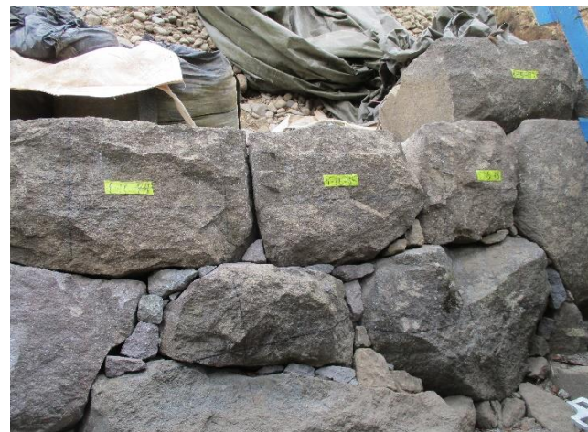
積直した石垣（16段目付近）