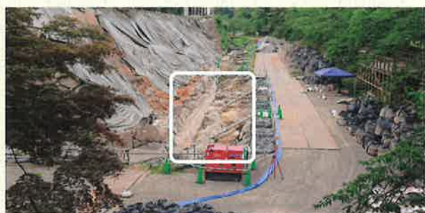
▲令和元年度の発掘調査地点（下乗橋から北を望む）

弘前図書館所蔵の「明治29年4月8日本丸天守閣石垣崩壊の図」（※2）は、当時天守台とその北側の石垣が大きく崩落・変形したことを現在に伝える資料です。帯コンクリートと石列は、図に描かれる石垣の崩壊・変形範囲内に収まるような位置に施工されています。明治29年以降、崩れた状態で長期間放置されてきた石垣を、再度強固に積み直そうとした大正時代の職人たちの工夫が感じられる遺構です。