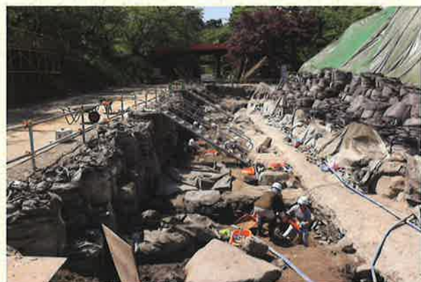
▲天守台根石付近の発掘調査風景（北から）