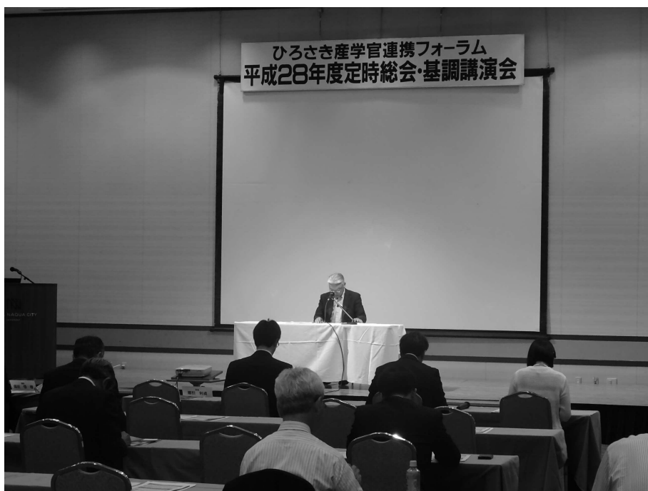
平成28年度 定時総会の様子