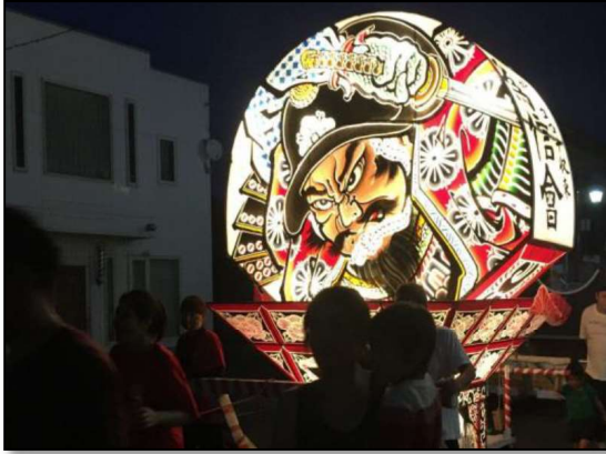
賀田通りを通過するねふた

地域おこし協力隊に着任して、早くも半年が経ちました。 雪の残る春から、ねふたの夏を過ごした、地域おこし協力隊の 活動についてご紹介します。