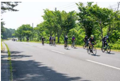
岩木山ヒルクライムの様子（嶽地区）

6月27日、県内在住者限定参加で行われた「チャレンジヒルクライム岩木山2021」に交通整理で参加いたしました。