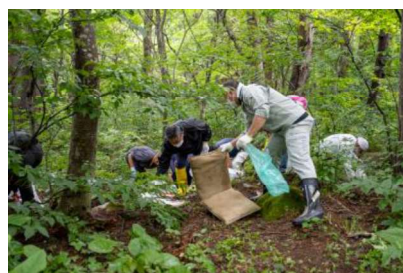
ごみを撤去する様子（岩木山麓）

ほかにも道路脇でのごみ収集などを行い、ごみ収集車がいっぱいになるほど。このような活動を通して岩木山周辺を大切に守っていく活動を続けたいと感じました。 対馬