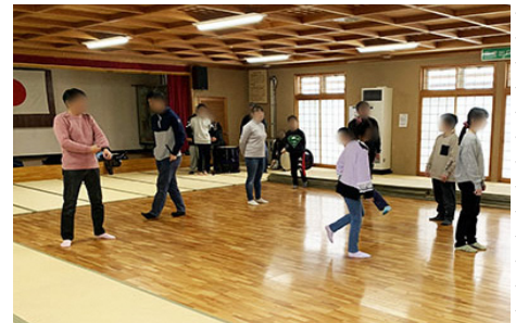
「お囃子に合わせて踊ってみましょう！あ、●●くん、”おかしこ”に入って！！久しぶりだけど、大丈夫でしょ？」