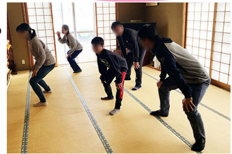
動画で概要を掴んだ後に、ひと節ずつ区切って練習。