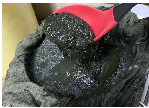
1回目の実験で、10月に抽出できた“沈殿藍”

しかし、“沈殿藍”ができたからといって、それで完成ではありません。これを水で薄めて、熟成させて初めて染料ができるそうです。少量しか沈殿藍がないので、時期的に熟成が無事に進む時期なのか、確認してから次の実験に進みたいと思います。