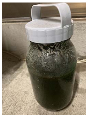
水分を切り、内容量900mlの容器に入れるとこのくらい…