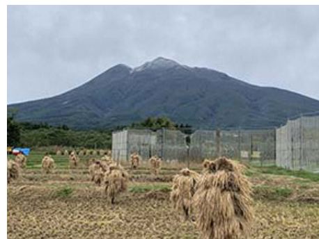
撮った写真を確認したら、自分が棒掛けしたものが写り込んでいなかった…

私個人の所感としては、去年の棒掛けより今年の棒掛けのほうがかきれいに仕上がって満足！！（…上達？）