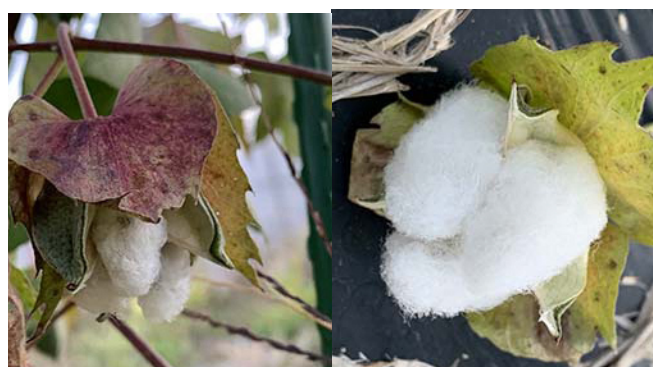
余談ですが、実験栽培中の和棉の実がはじけ始めました！昔は寒くて青森で育たないと言われてましたが、気候が温暖化していると実感。