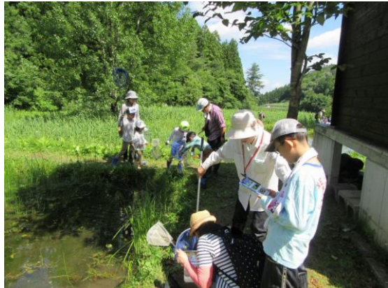
だんぶり池観察会