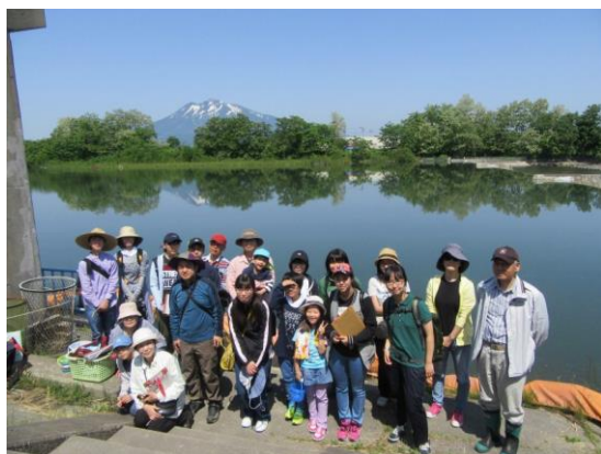
身近な水環境の全国一斉調査