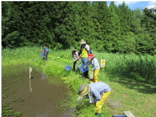
県委託事業だんぶり池観察会

・平成30年8月9日 自然環境グループ だんぶり池動植物観察会 9時 13名参加 エコクラブ だんぶり池生き物観察会