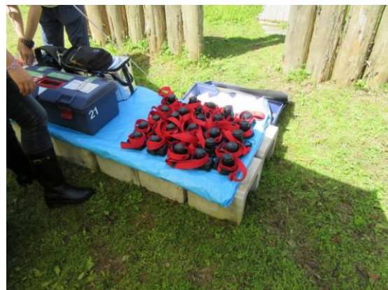
キヤノンプレシジョン提供デジカメ