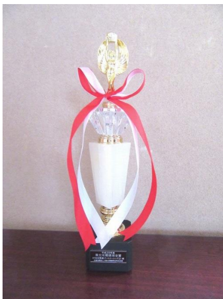
水環境保全賞トロフィー