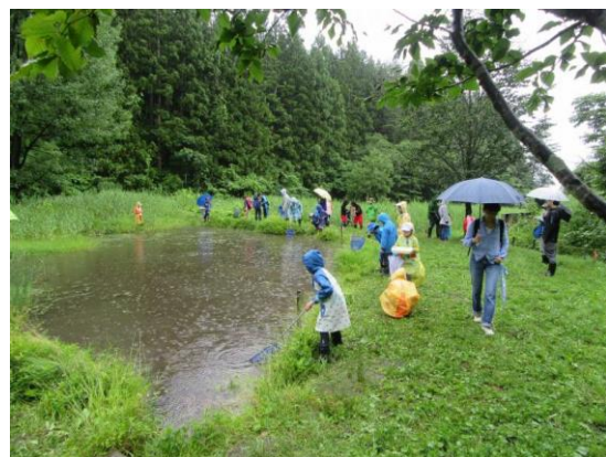
中央公民館だんぶり池観察会