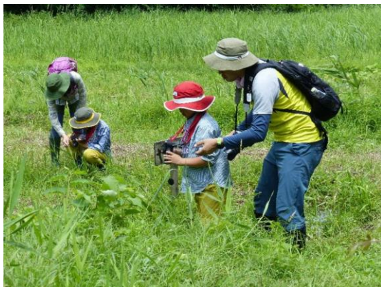
クローズアップ撮影会