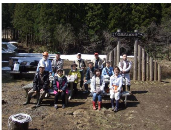
だんぶり池作業始め