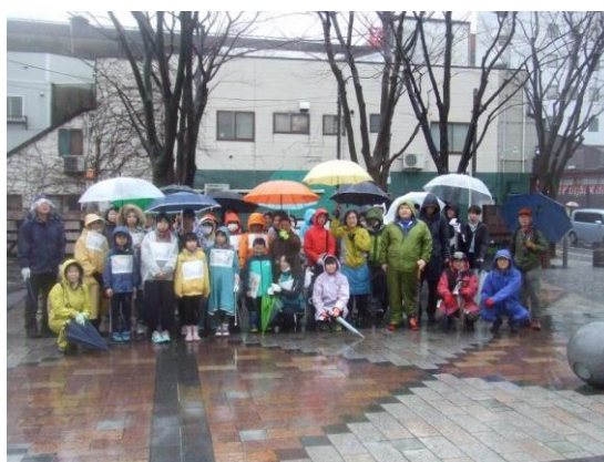
まちかど広場クリーン大作戦