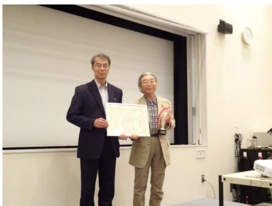
水環境保全賞表彰式