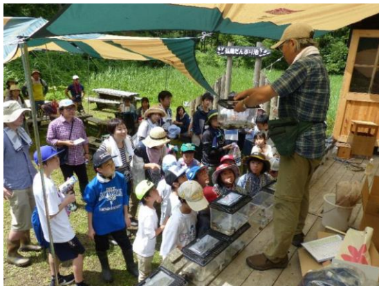
だんぶり池水族館