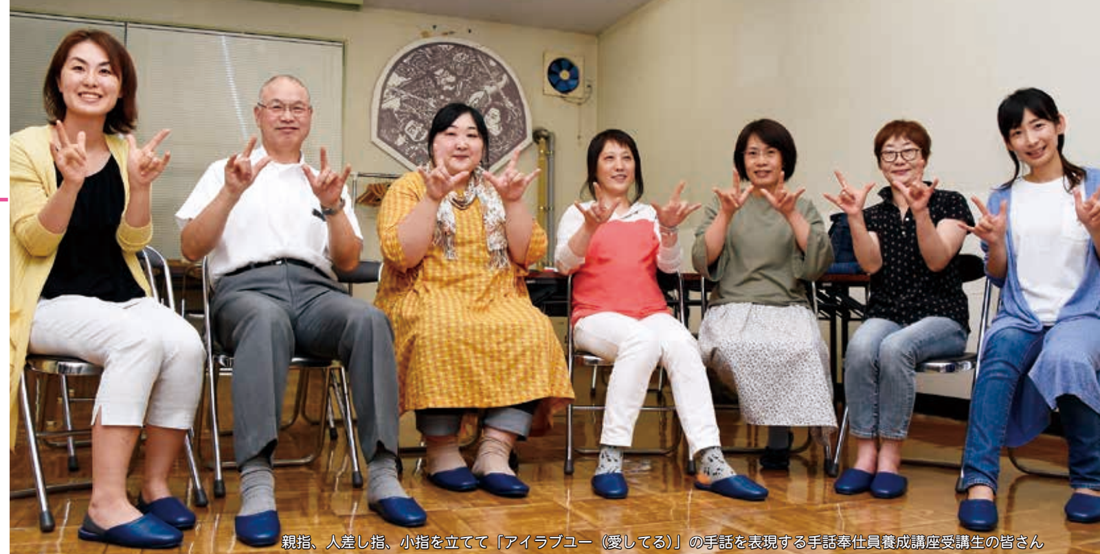
親指、人差し指、小指を立てて「アイラブユー（愛してる）」の手話を表現する手話奉仕員養成講座受講生の皆さん