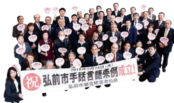
※ろう者…耳が聞こえない人のうち、手話を母語とし、手話でコミュニケーションをとる人たち。