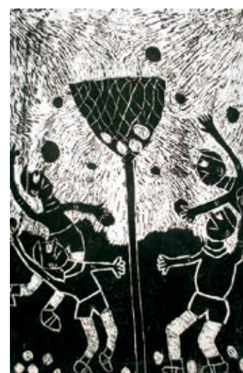
タイトル 玉入れ何こも入ったぞ