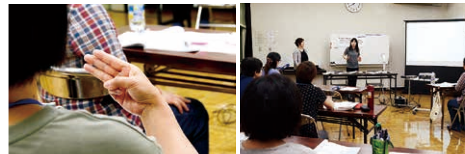
手話奉仕員養成講座の様子

音で表現できない分、表情や動きで表現しないといけないところが手話の面白い部分でもあり、難しい部分でもあると思います。条例が制定されたことで、さまざまなところで手話を見る機会が増えて、たくさんの人に手話を知ってもらえると思います。私も今後はボランティア活動などで手話を使っていきたいです。