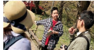
さくらまつり開会式での手話通訳(上)、手話による観光ガイドの試行(下)