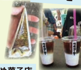
はちすずめ菓子店

地元・弘前のコーヒー屋と岩手県紫波郡の菓子店のコラボ! ほんのり甘いカフェオレを飲みながらオーガニック素材のケーキを食べる時間は幸せでした♪