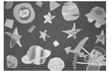
▲昨年度の優秀作品