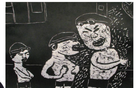
タイトル つめたい！ だけどがまんだ

■問い合わせ先 介護福祉課（①～④…☎40-7049、⑤…☎40-7071、⑥…☎40-7114）