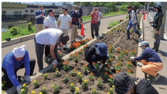
5月25日 新寺構遊歩道（桶屋町）

ひ ろさき地方創生パートナー企業の取り組みとして、障害福祉サービス事業所ワークランド茜の利用者・職員と市職員が協働で植栽を実施。青空の下、色鮮やかな花で花壇を彩りました。