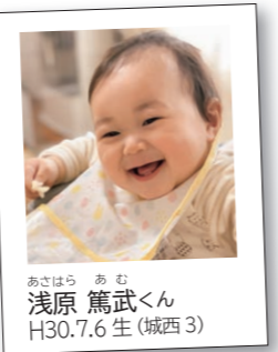
あさはら あむ 浅原 篤武くん H30.7.6生(城西3)