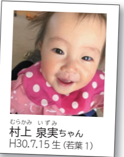
むらかみ いずみ 村上 泉実ちゃん H30.7.15生(若葉1)