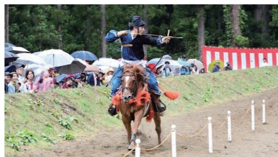
6月16日 高照神社馬場跡（高岡字獅子沢）

雨 の中、伝統武芸の流鏝馬が披露されました。直垂（ひたたれ）装束を身にまとった4人の騎手が馬にまたがり、人馬一体となつて的を射抜く姿に、訪れた観客が盛大な拍手を送っていました。