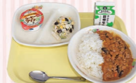
【ブラジル】 豆を使ったひき肉のカレー、コールスローサラダ、コーヒープリン