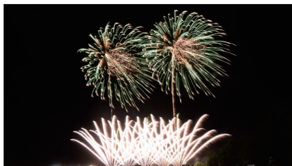
6月15日 岩木川河川敷運動公園（悪戸字鳴瀬）

津 軽地方で最も早い花火大会が開催されました。全国の花火師が手掛けた色とりどりの花火に、会場を訪れた約1万6,000人の観客が心を躍らせた。