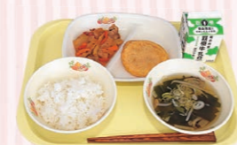
【台湾】 サンパイジー(鶏肉を使った台湾料理)

両選手団の合宿に合わせ、小・中学校の学校給食(給食センター所管校)で台湾とブラジル料理の献立を提供します。