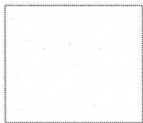
角印(使用する場合)