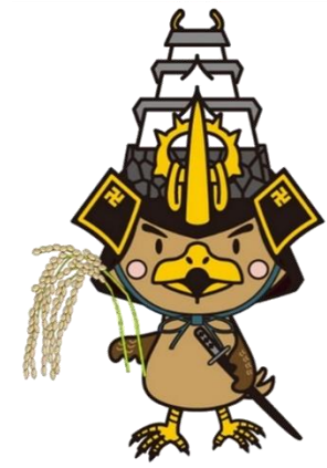
弘前市 マスコットキャラクター たか丸くん