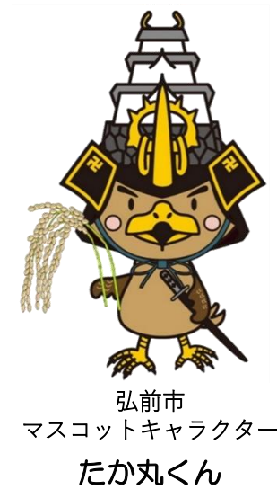
弘前市 マスコットキャラクター たか丸くん