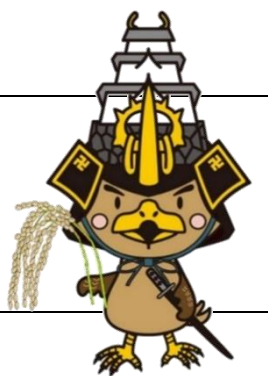
弘前市 マスコットキャラクター たか丸くん