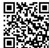
募集説明会 申込フォーム