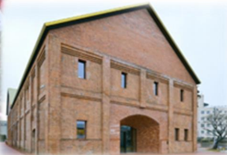
弘前れんが倉庫美術館