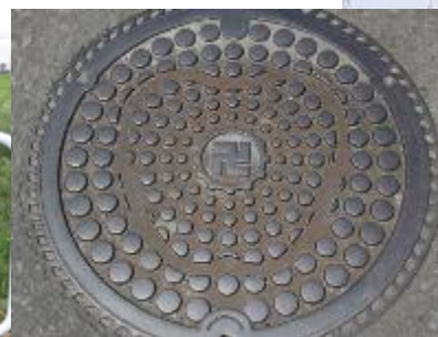
りんごマンホール