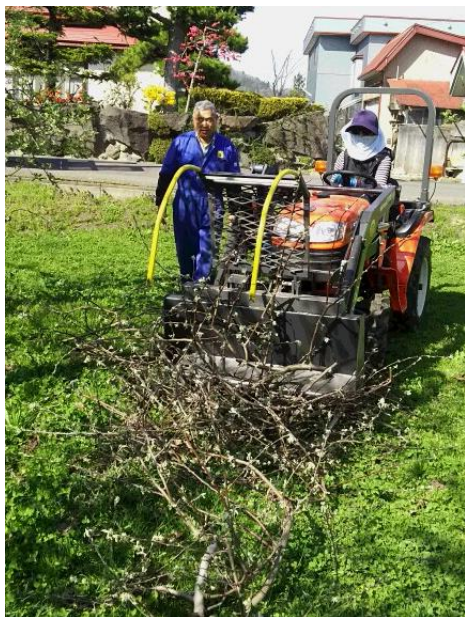
剪定枝回収作業の様子