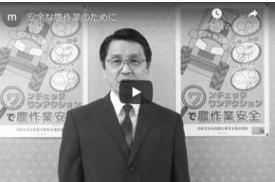
『安全な農作業のために』（農林水産省）