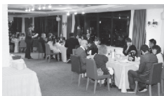
なごやかな雰囲気 の参加者たち

りだくさんのスイーツや料理を囲みながら交流を深め、最後に行われたカップリングでは、10組のカップルが誕生しました。今後の進展が期待されます。