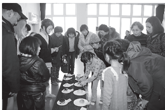
入念な審査の様子