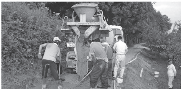
共同作業による整備状況