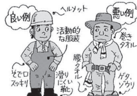
機械に巻き込まれないような服装を!