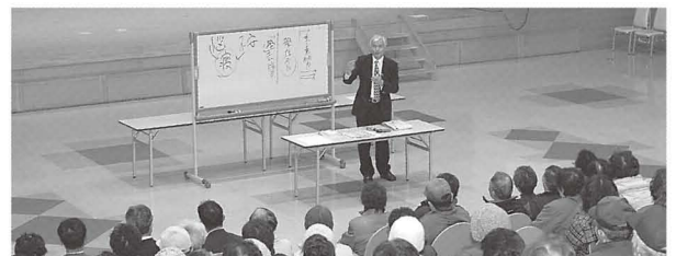
昨年の講演会の様子