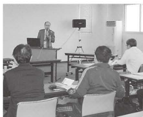
第1回セミナーの様子