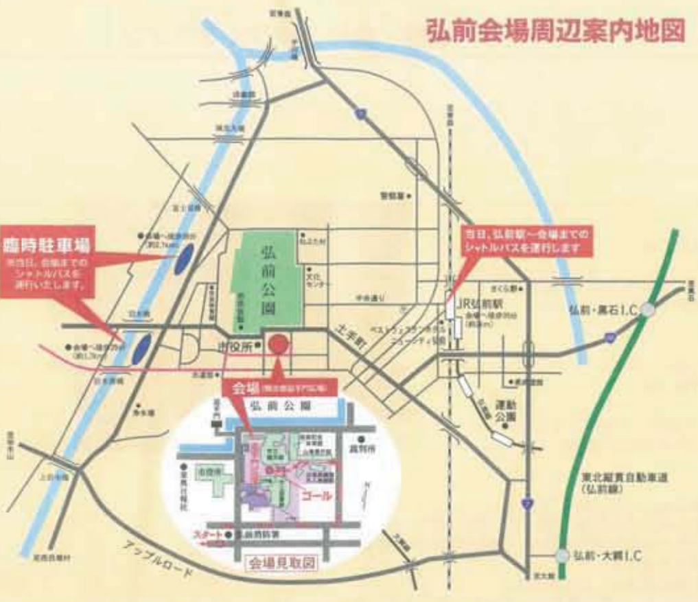
弘前会場周辺案内地図