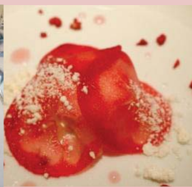
←りんごのデザート