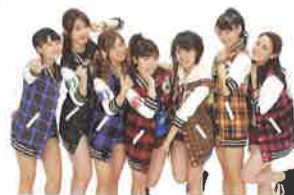
公式応援団 アップアップガールズ(仮)