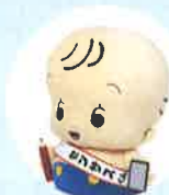
国勢調査 イメージキャラクター センガスクん