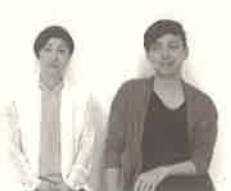
matohu (デザイナー) ※TV会議参加