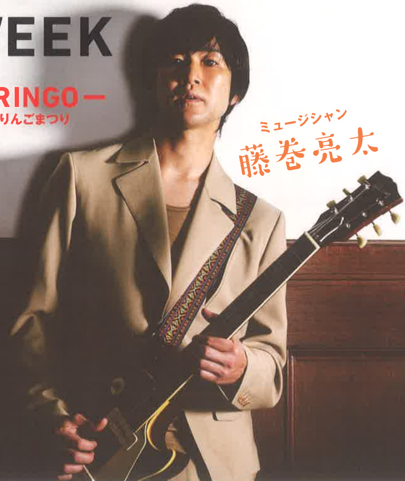
ミュージシャン 藤巻亮太