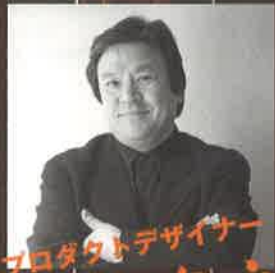
プロダクトデザイナー 喜多俊之