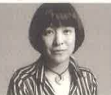
生駒芳子 (ファッションジャーナリスト)