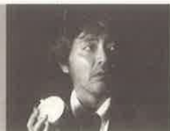
菱川勢一 (映像作家)