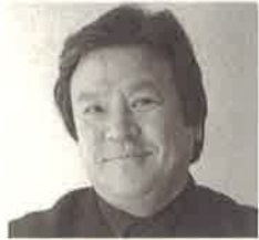
喜多俊之 (プロダクトデザイナー)

開催日時：2016年10月9日(日) 14:00-15:30 会場：弘前市りんご公園 旧小山内家住宅 map-1 定員：30名(無料) 参加クリエイター：喜多俊之(プロダクトデザイナー)、 地元出演者(工芸品の職人など) 協力：青森県漆器協同組合連合会