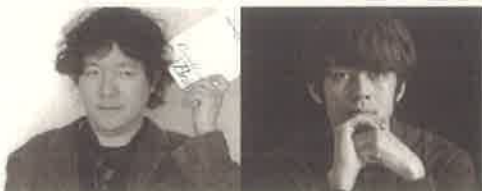
茂木健一郎 (脳科学者)

開催日時：2016年10月10日(月・祝) 20:00- 会場：市内居酒屋 定員：100名 会費：3,500円 茂木健一郎、西野亮廣、辰野しずか、生駒芳子、菱川勢一 応募資格：弘前アイデアソンの参加者(未成年不可) ※夜会のみ参加は受け付けできませんので、予めご了承ください。