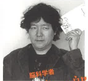
脳科学者 茂木健一郎