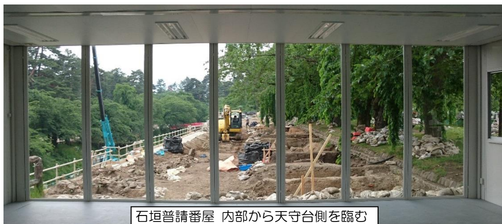
石垣普請番屋 内部から天守台側を臨む

※南面が石垣修理現場方向にあり、ガラス張りにすることにより、作業進行状況を見学することができる。