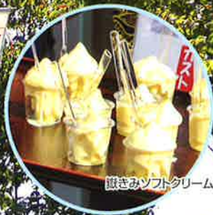
職きみソフトクリーム