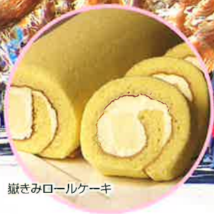
職きみロールケーキ