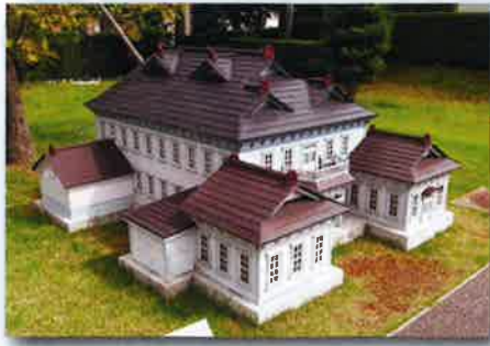
大雪像 旧弘前市庁舎

北の郭エリアにおいていただいた方にキャンドルをお渡しします。それを思い思いの場所にどうぞ。皆様がおいたキャンドルたちが、明りの溢れる空間を創り出します。 【期間中 17:00~21:00】