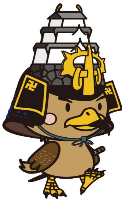
弘前市公式キャラクター たか丸くん