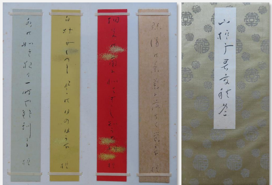
句帖「山梔子春夏秋冬」

山梔子が『山梔子第一句集』の中から 50 句を選び、自書した短冊が収められている。作成時期は、昭和 11 年から 18 年までと推定される。