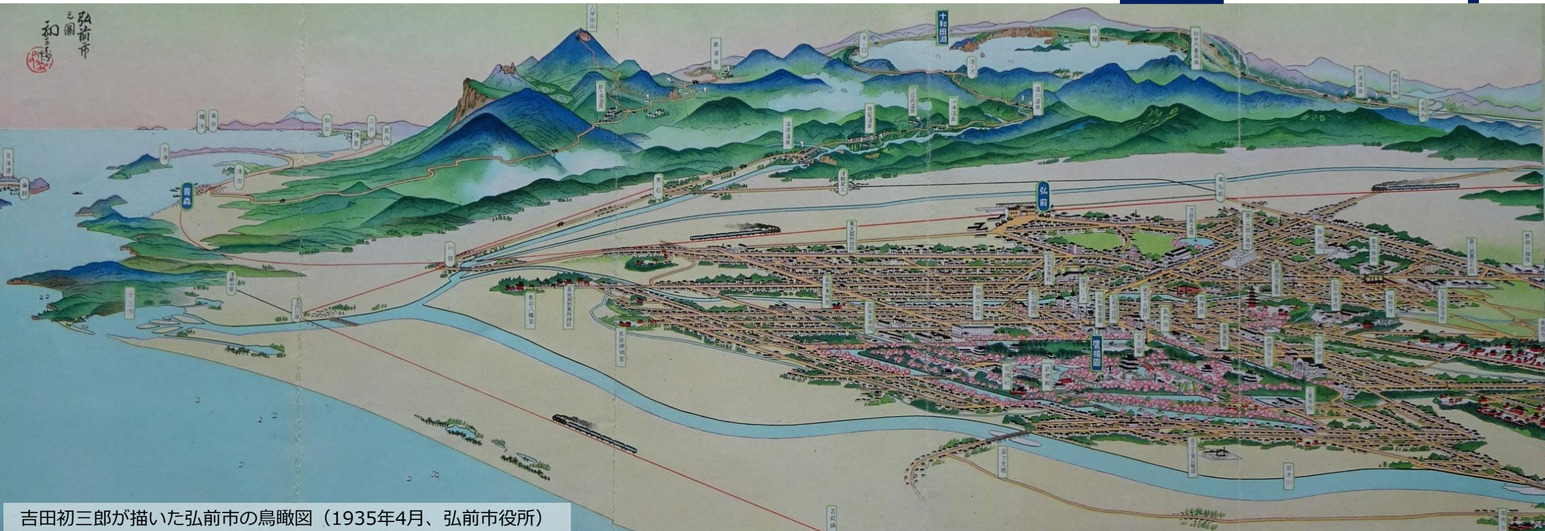
吉田初一郎が描いた弘前市の鳥瞰図(1935年4月、弘前市役所)