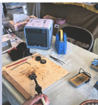
ワークショップの様子②

スタート部門を活用した後、一般部門に申請して 実施されている事業も数多くあります！