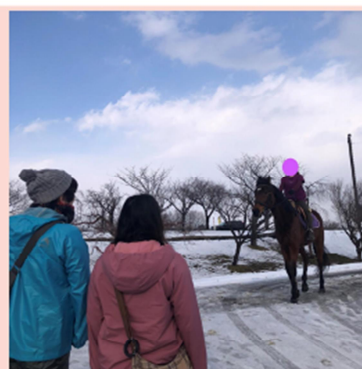
お馬さんとふれ合っている様子