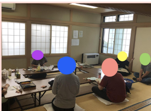
交流しながら自由な時間を過ごします

自分の得意なことや好きなことを誰かに見てもらえる小さな発表の場になり、参加者の自信ややりがいにつながりました。また、参加者がお互いに教え合うミニワークショップのような場面もありました。