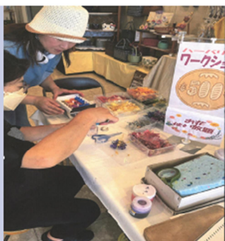
ワークショップの様子①

こぎんのほか、ハーバリウム、スタンドグラス、アメリカンフラワーなどのワークショップを行い、30人ほどの参加がありました。ねぷた時期を利用して土手町で開催したことにより、市内外の方々に土手町に立ち寄ってもらう機会が作れました。