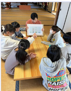
子ども達は思い思いに過ごします