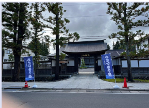
お寺で行われています

児童、学生、地域ボランティアのみんなが協力し合い交流することができました。子どもたちは、学生ボランティアに勉強など様々なことを積極的に聞いて、食事の片づけなども手伝ってくれました。多世代交流ができたと思います。