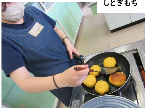
津軽地方の甘いお赤飯