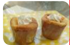
生シフォンケーキ