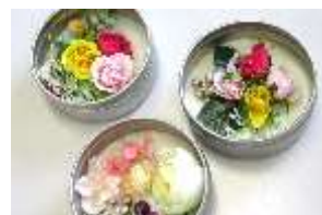
蜜蝋缶完成品イメージ