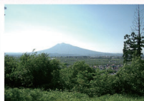
⑤狼森陸羯南詩碑(鶯の巣山) 鶯の巣山の山道を登ると、岩木山と市街地を一望することができます。

大 鰐弘前IC周辺とアップルロード周辺のエリアです。岩木山やりんご園、田園風景など弘前ならではの風景がたくさんあります。何度も来たいと思える風景ばかりです。