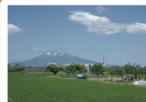
①国道7号大鰐弘前IC付近 大鰐方面から弘前に入ると、広大な岩木山と故郷を感じさせる田園風景が迎え入れてくれます。