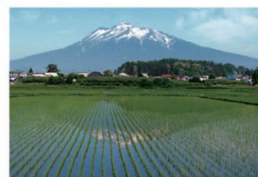
④独狐地区の水田 田植えの時期には、水田には美しい岩木山の姿が映ります。早朝に正面から陽が当たる風景がおすすめです。