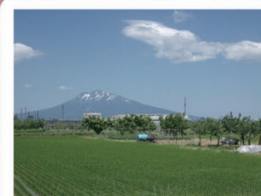
①国道7号大鰐弘前IC付近 大鰐方面から弘前に入ると、広大な岩木山と故郷を感じさせる田園風景が迎え入れてくれます。