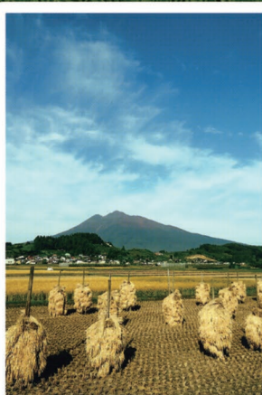
⑩横町野崎橋付近 岩木地区の集落を散策すると時おり岩木山と田園風景が現れ、「岩木山のあるまち」を実感できます。