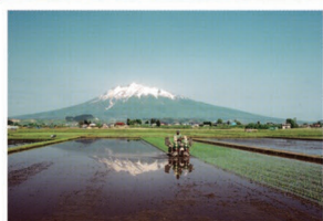
⑨横町の田園 【元薬師堂一町田線沿い】 田園に囲まれたまっすぐな道。岩木山、田園そして農村風景が続く岩木地区ならではの風景です。