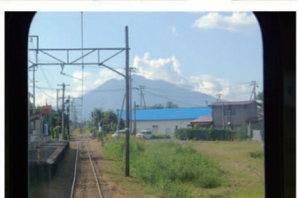
③小栗山駅 線路の先にそびえ立つ岩木山。麓まで電車で行けたらいいのに、なんて思ってしまいます…

弘 前市と大鰐町を結ぶ弘南鉄道大鰐線の車窓からも、田園風景や岩木山など、弘前らしくどこかノスタルジックな風景を楽しむことができます。ゆっくり流れる時間を弘前の風景と共に過ごしてみませんか？