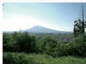
⑤狼森陸羯南詩碑(鶯の巣山) 鶯の巣山の山道を登ると、岩木山と市街地を一望することができます。

大 鰐弘前IC周辺とアップルロード周辺のエリアです。岩木山やりんご園、田園風景など弘前ならではの風景がたくさんあります。何度も来たいと思える風景ばかりです。