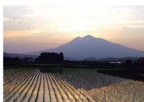
⑪真土保育園前 四季折々の岩木山と田園風景。美しい風景と共に外で遊ぶ園児たちは、何を感じているのでしょうか…