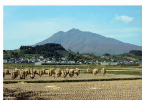
⑤石渡の水田 岩木川の西岸には田園地帯が広がり、岩木山の眺めと調和し、なんだか懐かしい気持ちになります。