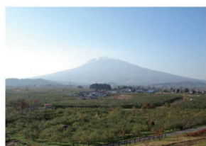
⑥独狐の森公園 小高い丘の上の公園からりんご園と岩木山が一望できます。映画「奇跡のリンゴ」のロケ地にもなりました。