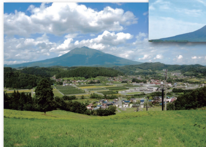
そうまロマンピアスキー場(P.11-12)