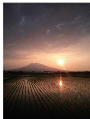
②健全弘前ホームあじさい周辺 国道7号桜並木の西側には岩木山を背景とした田園風景が広がっています。