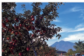
⑦富栄のりんご園 【やまなみロード沿い】 鱈ヶ沢方面に向かう広域農道。起伏があり岩木山とりんご園が共演する弘前らしい風景が楽しめます。

弘 前市の郊外北側から岩木地区東側のエリアです。季節によって異なる表情をみせてくれる岩木山の眺めを中心に、桜並木やりんご園の風景も楽しめます。