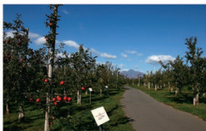
⑧りんご公園 すり鉢山展望台からは岩木山とりんご園を一望できます。時期によってりんごの成長過程も楽しめます。