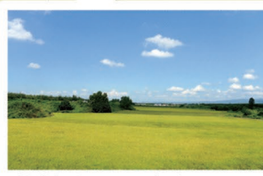
②津軽大沢駅から松木平駅の間 住宅街を抜けると広がる田園風景。「大鰐線は電車の速度が風景を楽しむのにちょうどよい」という声も。