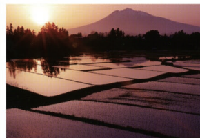
⑥墓地公園 アップルロード沿いの岩木山と田園風景を望む絶景ポイントの代表格です。