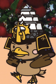
弘前市マスコットキャラクター たが丸くん