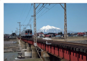
③大鰐線平川鉄橋 岩木山と鉄橋を渡る電車のコラボレーションは、弘南鉄道ならではの風景です。