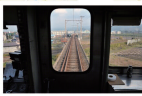
①石川 J R 交差 J R 奥羽本線と交差する鉄橋からの車窓風景。電車が交差する瞬間は鉄道ファンをうならせるかも？