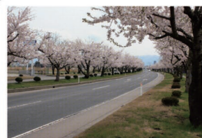
①国道7号線桜並木 弘前市民は、ここに咲き誇る約370本の桜を見て、春の訪れを実感するのだとか…