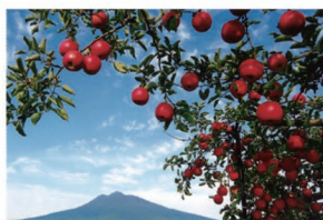
⑧富栄のりんご園 【独狐蒔苗線沿い】 岩木方面へ向かう道路沿いもりんご園が広がります。りんごの隙間から岩木山も顔をひょっこり。