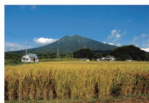
⑨三本柳温泉周辺 アップルロードを越えると、温泉の周辺はのどかな田園風景と岩木山が望め、心も体もリフレッシュできます。