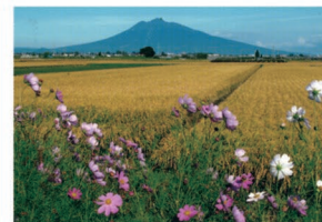
④アップルロード石川入り口付近 春と秋には一面に広がる野花と岩木山という季節限定の絶景を楽しむことができます。