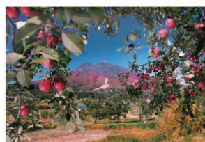
⑩三本柳 岩木山の手前にりんご畑が広がる弘前ならではの風景です。春にはりんごの花、秋には果実が楽しめます。