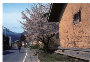
⑦小沢蔵街道 蔵が並ぶ津軽地方ならではの農村景観。背景には久渡寺山が望め、故郷を感じさせるような風景です。