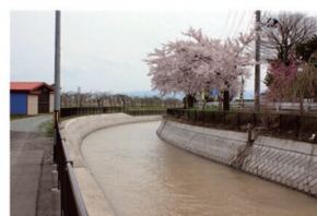
③三省小学校北側土淵堰周辺 春は桜並木、秋はりんごの実が生り、堰の疏水と共に潤いのある風景が楽しめます。