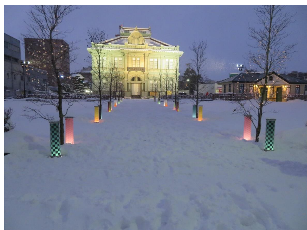
📷⑥ プロムナード（ライトアップの様子）