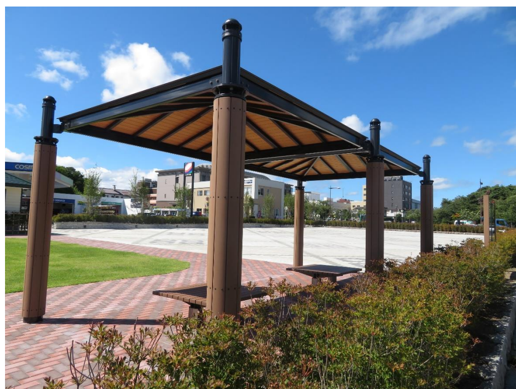
📷③ 東屋（憩いの広場側）