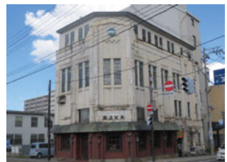
●三上ビル(旧弘前無尽社屋)