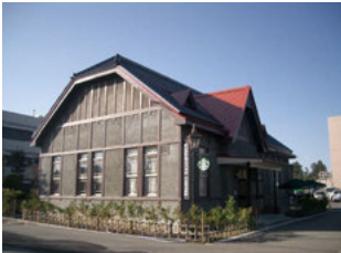
●旧第八師団長官舎(弘前市長公舎)

景観重要建造物とは 弘前市は「趣のある建物」をはじめとした和風建築や洋風建築、近代建築など歴史の奥深さや新しいものを積極的に取り入れてきた弘前市民の気質を感じさせる建物が、地域の良好な景観を形成しています。 市ではこれらの建物を景観法の規定に基づく景観重要建造物に指定し、適正な管理や改修費の助成等により保全を図り、弘前ならではの良好な景観づくりを目指しております。 表示板 景観重要建造物 石場旅館 一景観重要建造物一 指定件数: 18件 (2024年3月現在)