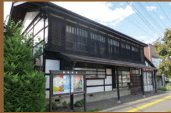
33 千葉家住宅 【栢町1-5 昭和3年建築】 切妻屋根、正面にはごみせが設けられているなど、町屋の形式が残る建物。近年まで「こうじ屋」と呼ばれ、漬物用の麹などを販売していました。