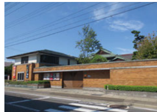
●翠明荘(旧高谷家別邸) 旧洋館、新洋館、日本館、奥座敷、土蔵、門、四阿、塀、中庭廊下(中庭を含む)