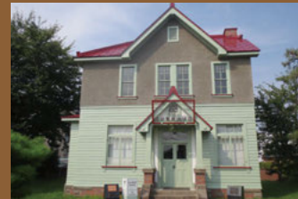
36 旧制弘前高等学校外国人教師館 【文京町1 大正14年建築】 登録有形文化財。煉瓦積み基礎、窓、外壁などに洋風建築の意匠が多く取り入れられている建物です。現在は大学生や地域の人が気軽に立ち寄れるカフェとなっています。

上 土手町のバス停から出発し、松森町方面へと向かいます。ごみせ造りの質屋の前を通り、松森町交差点から弘前大学方面へと向かいます。弘前銘醸煉瓦倉庫と太宰治も訪ねたと言われる旧制弘前高等学校外国人教師館を見た後、弘高下駅から弘南鉄道に乗ります。五重塔など車窓からの風景を楽しんでいるうちに、中央弘前駅へ到着するコースです。