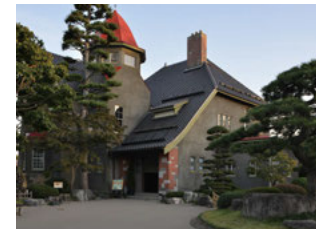
●旧藤田家別邸 洋館、和館、倉庫(考古館)、冠木門及び両袖番屋