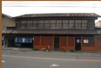
32 よしや質店 【松森町29 明治期建築】 幅4尺のごみせ、店先と2階の格子、暖簾が一体となって、歴史ある街道沿いの趣を醸し出している質店です。