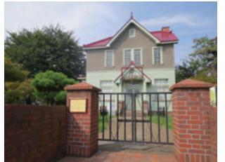
●旧制弘前高等学校外国人教師館