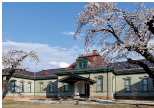
●旧弘前偕行社(重要文化財)