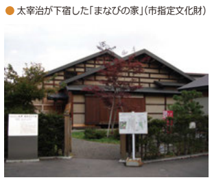
●太宰治が下宿した「まなびの家」(市指定文化財)