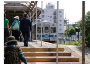
改札の向こうに見える●最勝院五重塔(中央弘前駅)