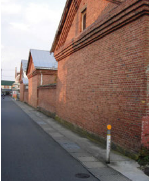
●弘前銘醸煉瓦倉庫と小道