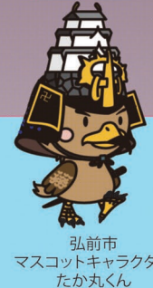
弘前市 マスコットキャラクター たか丸くん