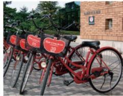
※2025年12月時点の内容です。