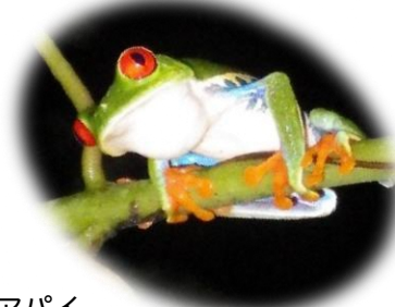
アカメアマガエル