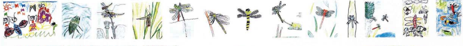
2010年度 活動計画 (ひろさき環境パートナーシップ21 自然環境グループ)