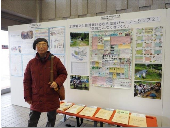
表彰式会場HE P 2 1 展示