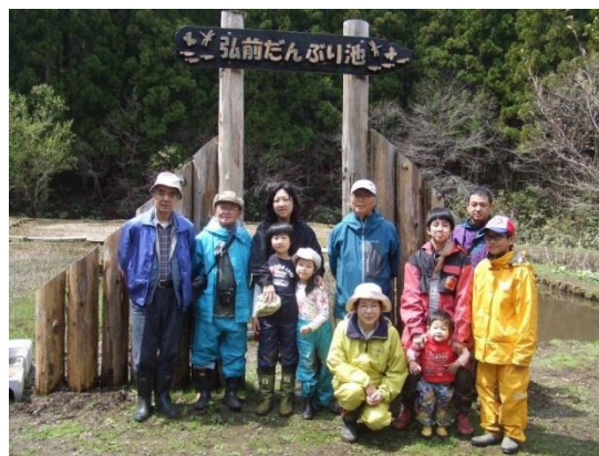
だんぶり池作業始め