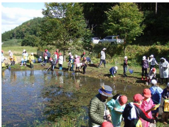
小沢小学校第2回だんぶり池観察会