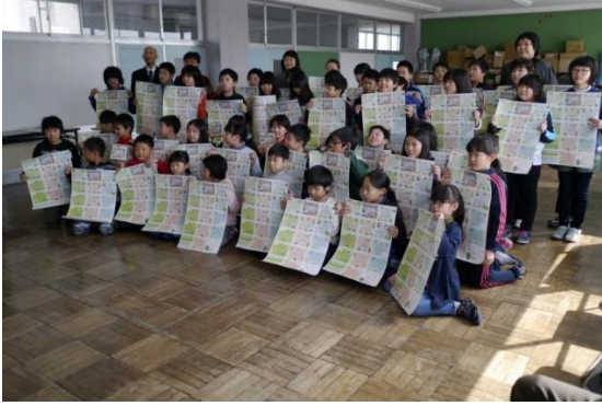
小沢小学校カレンダー贈呈