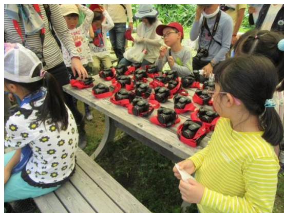
キャノンプレジジョン提供カメラ