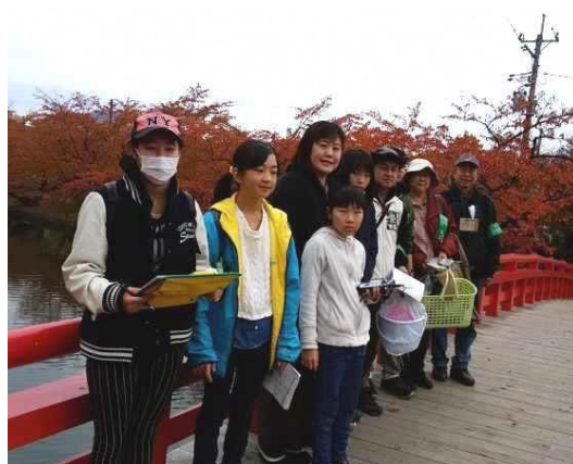
弘前公園探検隊パートIV