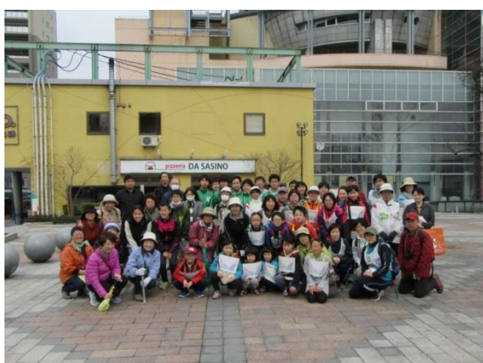
まちかど広場クリーン大作戦