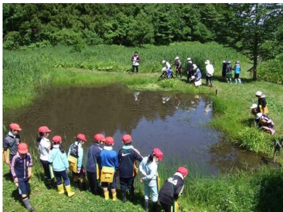
小沢小学校だんぶり池観察会