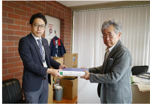
ごみに係るHEP21提言書提出