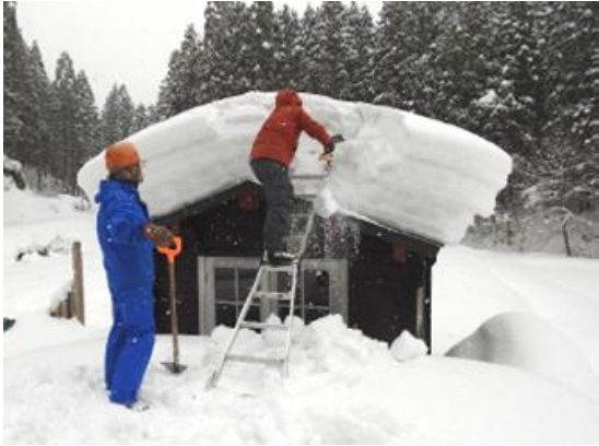
だんぶり池小屋の雪下ろし