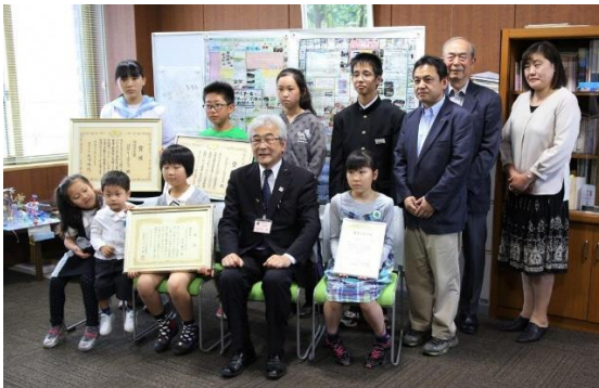
エコクラブ教育長表敬訪問