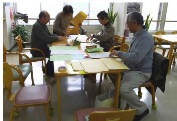
だんぶり池カレンダー仕分け作業