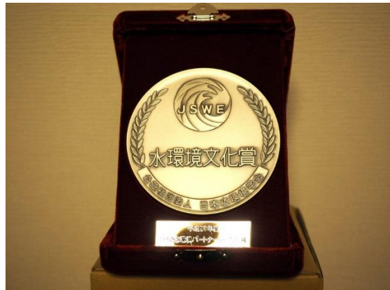
水環境文化賞メダル