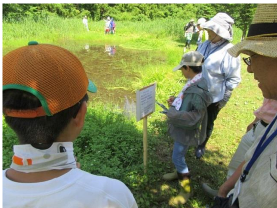
ウォークラリー形式クイズゲーム