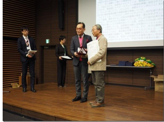
水環境文化賞表彰式