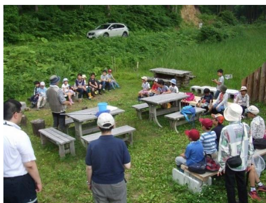
中央公民館子ども自然観察クラブ