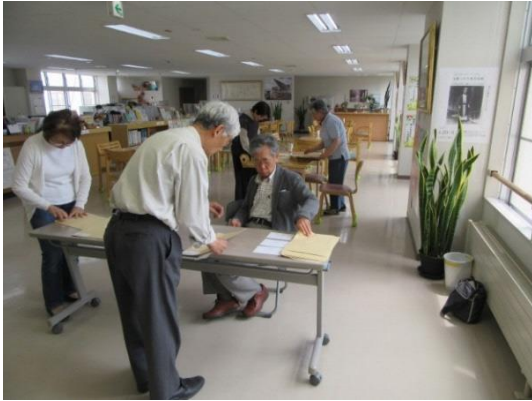
全体会議資料発送準備会