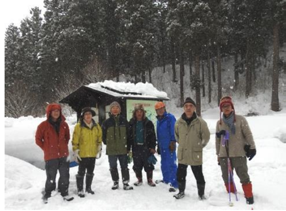
だんぶり池小屋の雪下ろし