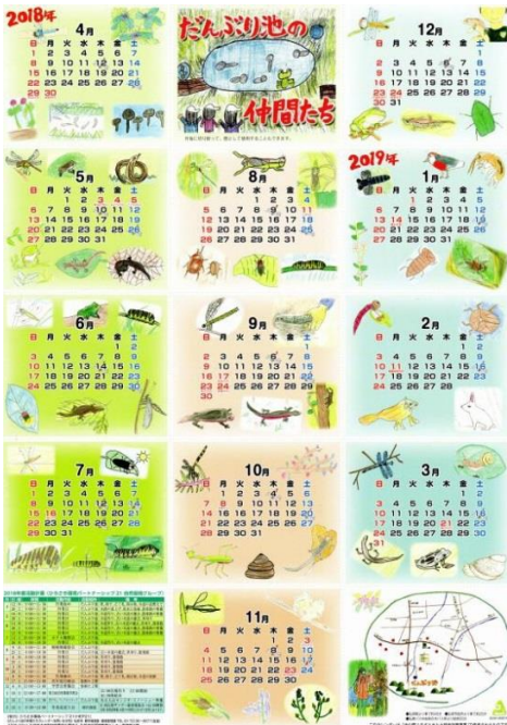
2018だんぶり池カレンダー