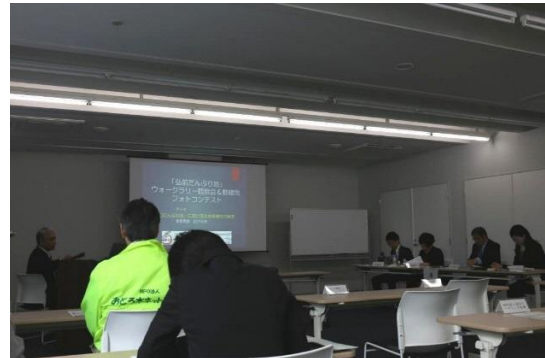
青森県企画提案競技