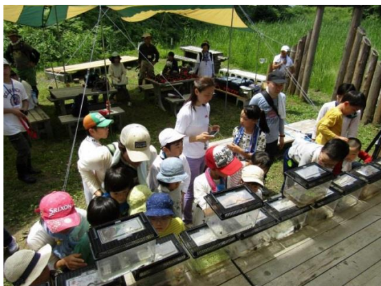
だんぶり池水族館