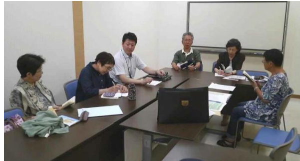
食品ロス第2回会合