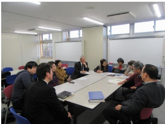
食品ロス第8回会合