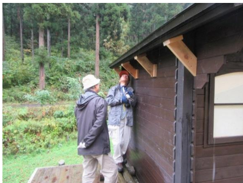
だんぶり池作業小屋軒下補強