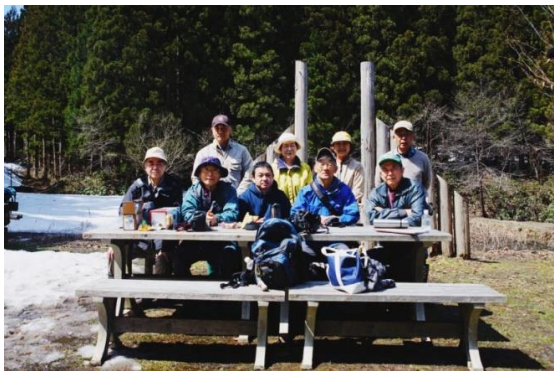
だんぶり池作業始め