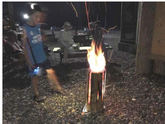
エコキャンプ丸太ファイヤー