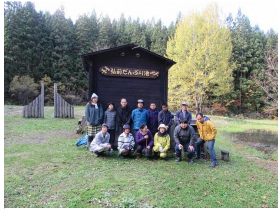
だんぶり池作業納め