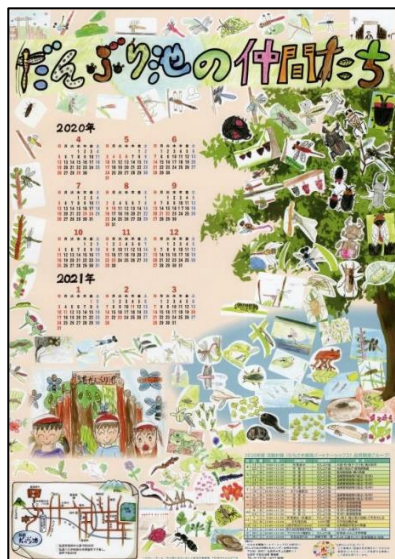
2020だんぶり池カレンダー