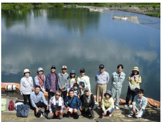
身近な水環境の全国一斉調査