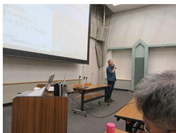
村田自然環境GL挨拶