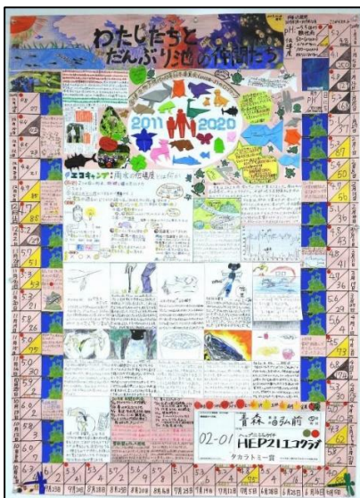
エコクラブ壁新聞