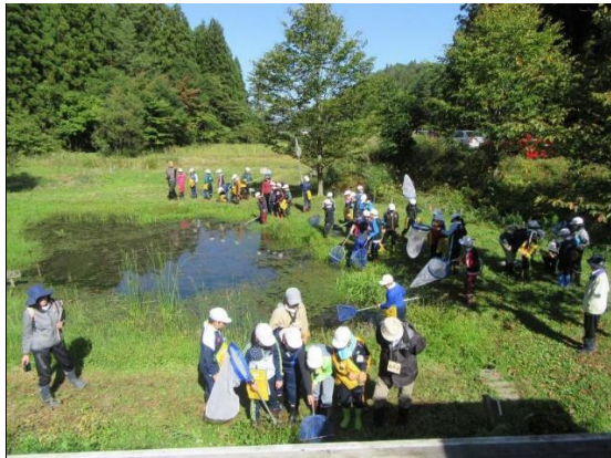
第2回小沢小学校だんぶり池観察会