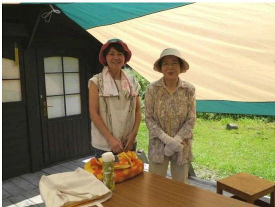
エフエムアップルウェブだんぶり池