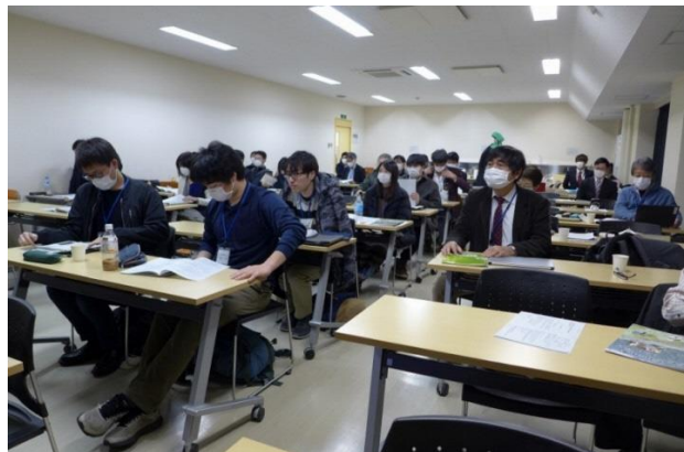
環境教育学会招待講演