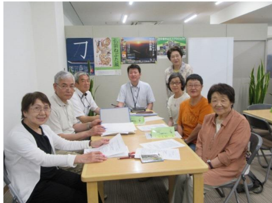
食品ロスプロジェクト第3回会合