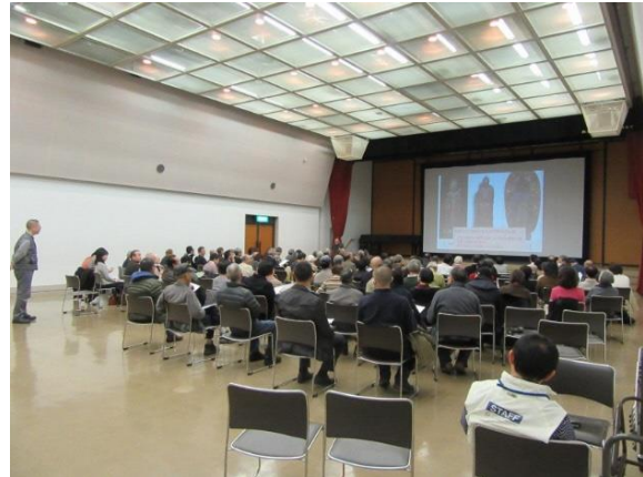
ひろさきお寺の日おさらい会