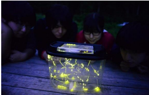
だんぶり池ホタル観察会