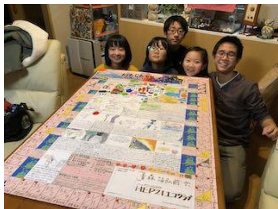
エコクラブ壁新聞づくり