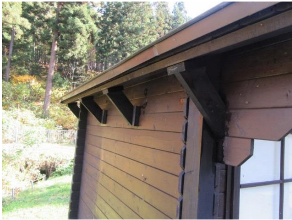
だんぶり池作業小屋軒下補強完成