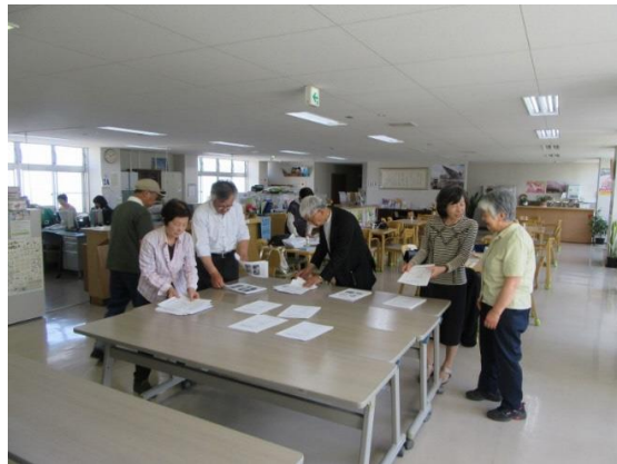
全体会議準備作業