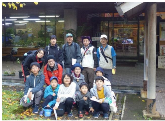
弘前公園探検隊パートVI