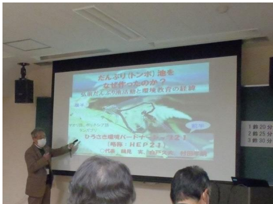
環境教育学会招待講演