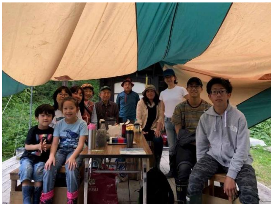
春のたんぶり池探検隊