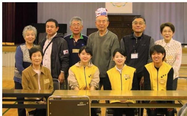
キッズハローワーク2019