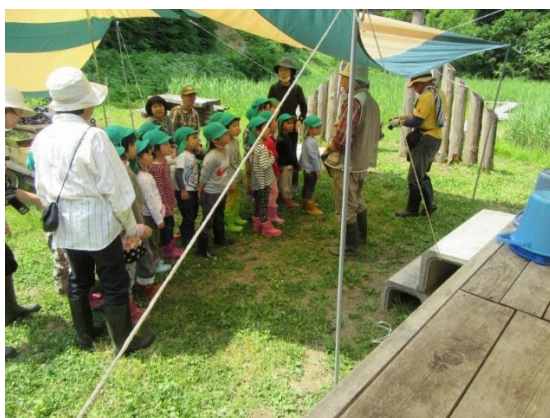
城東保育園たんぶり池観察会