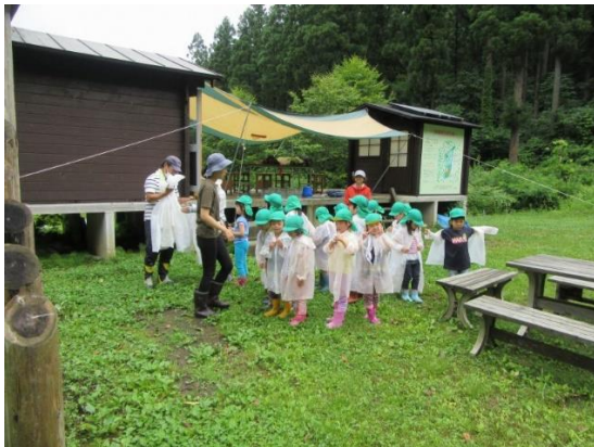
城東保育園だんぶり池観察会