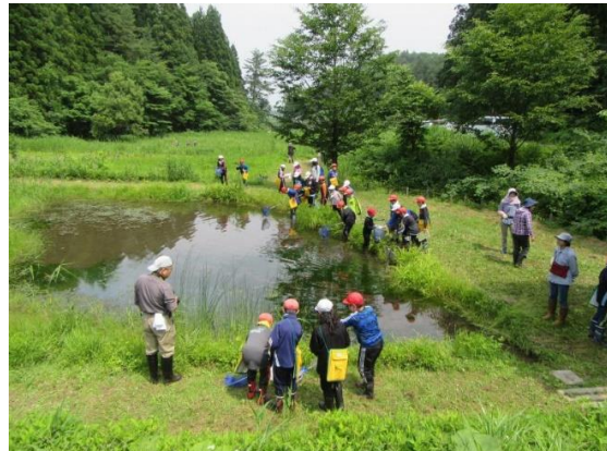
小沢小学校だんぶり池観察会