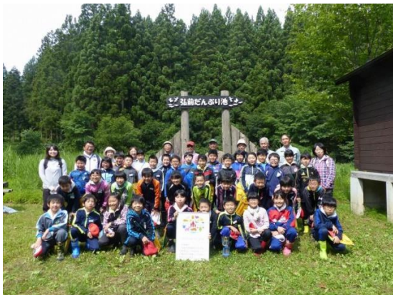
UNDB-J ロゴマーク掲示セレモニー