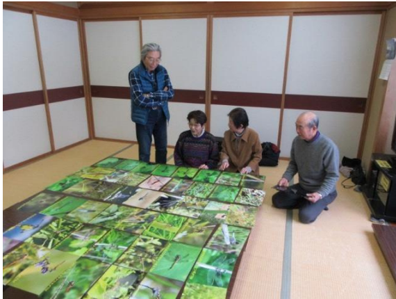
だんぶり写真ラミネート作業