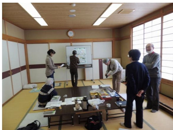
トンボイラストなど貼付け

・令和6年12月24日 第五回カレンダー編集会議 10時～ 清水交流センター和室 7名参加 トンボイラスト等貼付原案完成