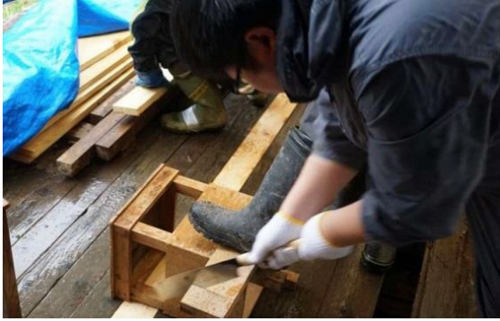
床板材の切り出し