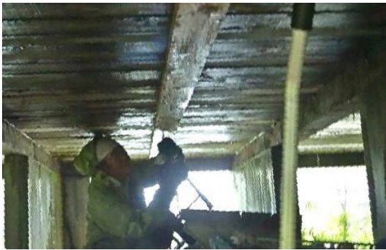
床下からも仮補強