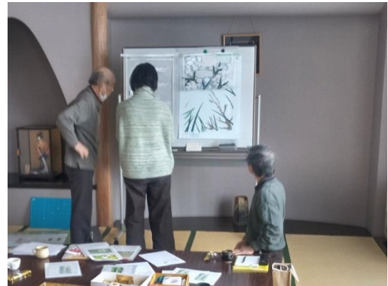
背景デザインの検討