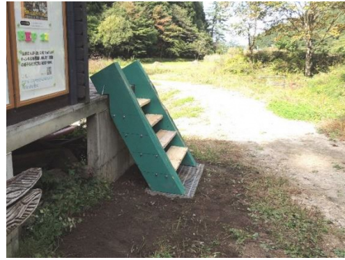
新階段の据付完了