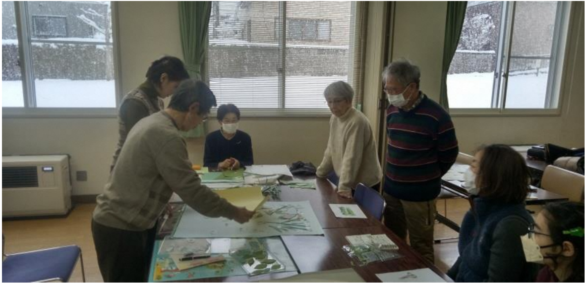
背景デザインの検討