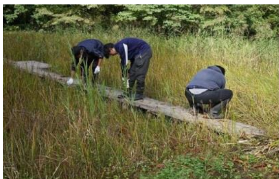
カナコ菴過剰繁茂植物の除去作業