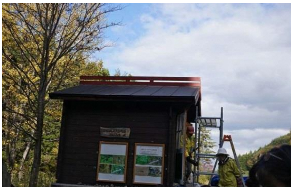
観察小屋屋根雪割板塗装完了