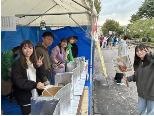
10月19日「カレーワドワジャ」