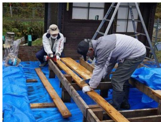
雪囲い用木材の切り出し