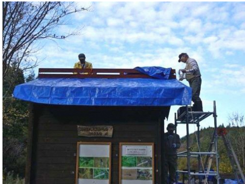
観察小屋屋根ブルーシート掛け