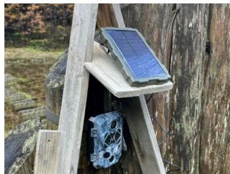
トレイルカメラに太陽電池パネル接続 (セブン-イレブン市民活動助成品)