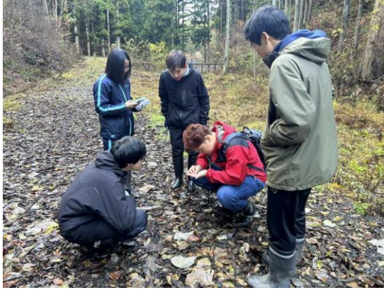
わどわ赤沢上流の観察