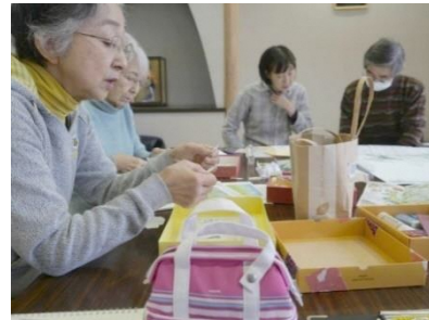
イラスト画切り抜き