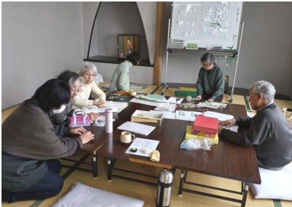
背景デザインの検討