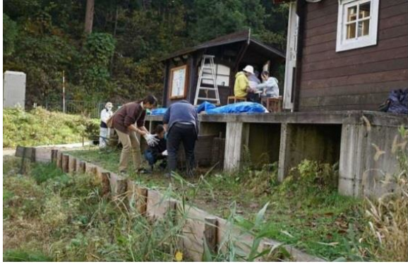
木道天板をデッキ床下に収納