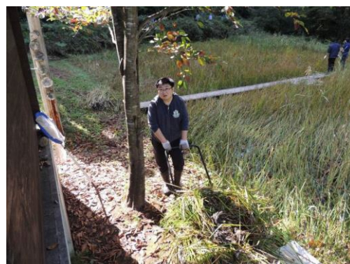
除去した過剰繁茂植物の片付け