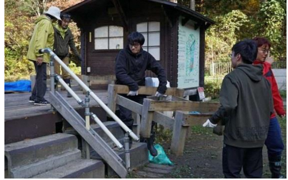
物置台脚部をデッキ上へ片付け