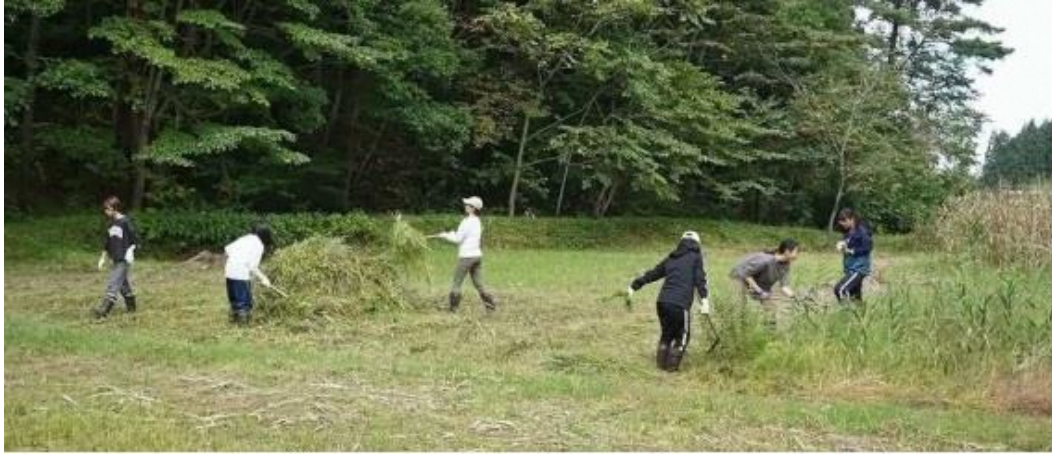
上下ヤナギ堰の刈草の片付け