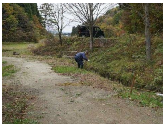
境界トラロープ取外し