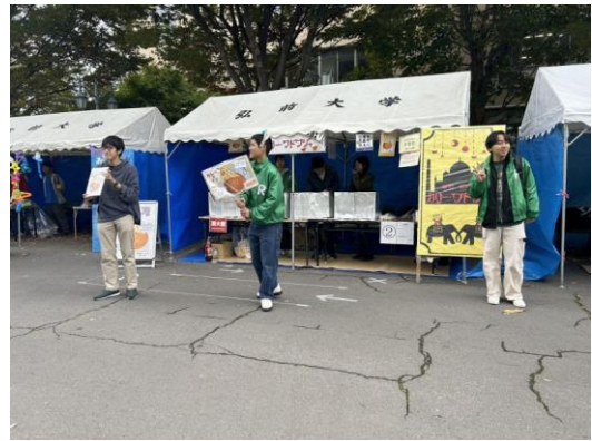
10月20日「カレーワドワジャ」