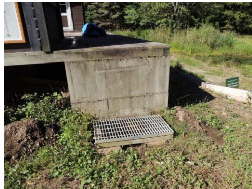
着工前の階段基礎