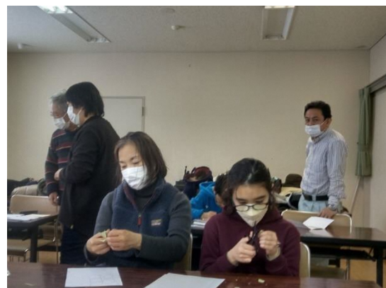
エコクラブお手伝い