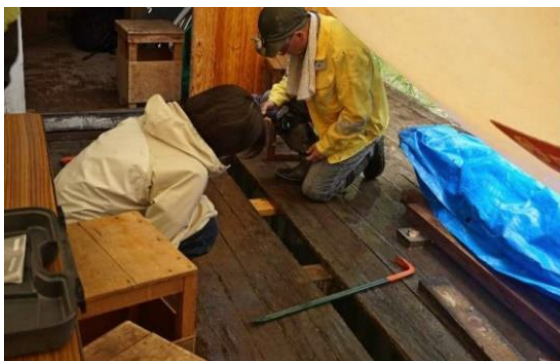
傷んだ床板の取り外し