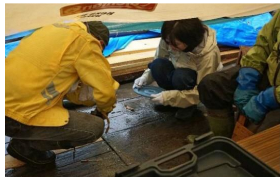
傷んだ床板の取り外し