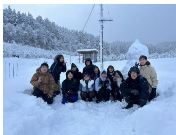
12月22日わどわ雪だるまづくり

・令和6年12月24日 第五回カレンダー編集会議 10時～ 清水交流センター和室 7名参加 トンボイラスト等貼付原案完成