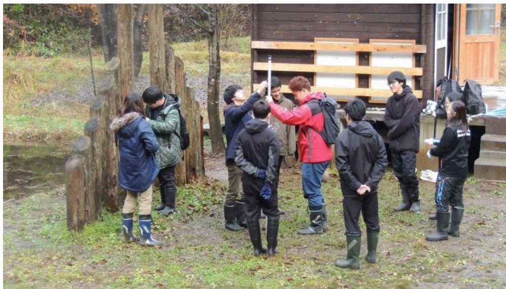
わどわの皆さんによる積雪深計とトレイルカメラ・太陽電池パネルの設置