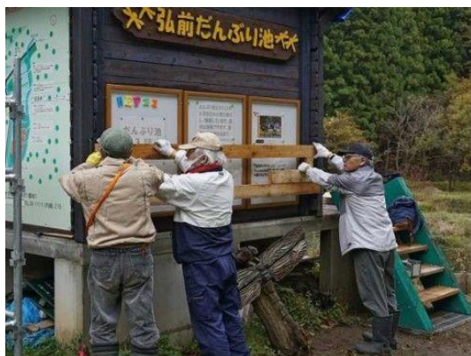
作業小屋掲示板雪囲い