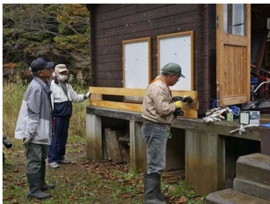
観察小屋掲示板雪囲い