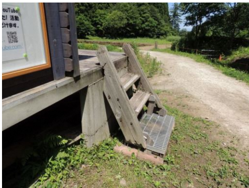
撤去前の旧階段 (9月1日)