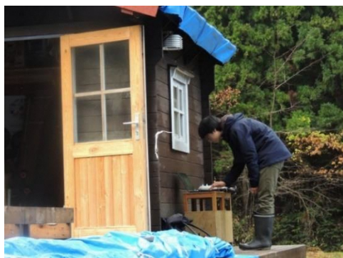
気象観測装置の点検