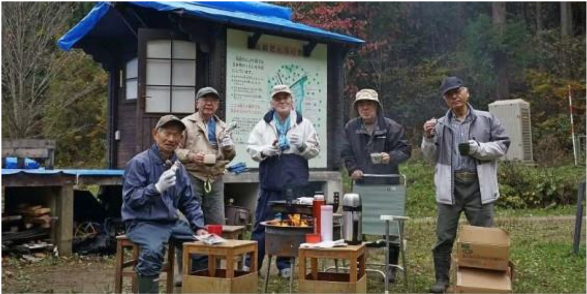
作業終了後、さつま芋（紅はるか）と鶴見コーヒーで乾杯