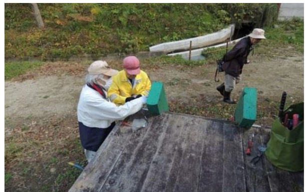
階段固定金具取替え（かすがい取外し）