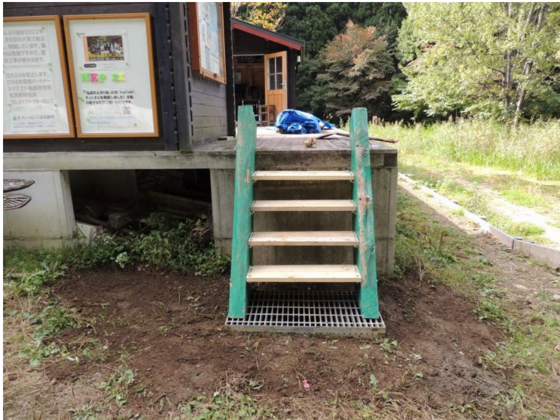
新階段の据付完了