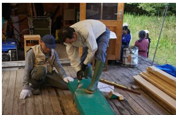
デッキ階段の製作