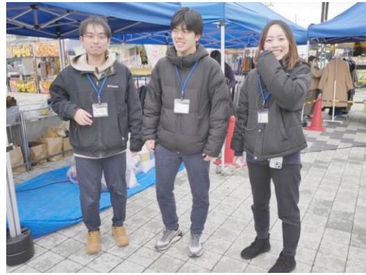
12月1日いいフェス実行委員会の皆さん