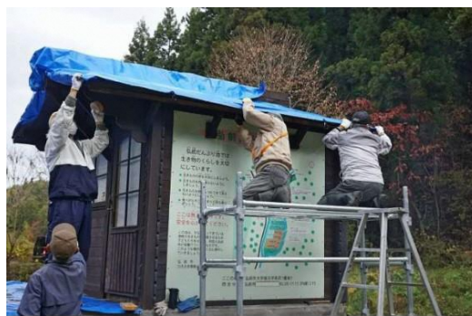
作業小屋屋根ブルーシート掛け