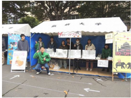
10月20日「カレーワドワジャ」