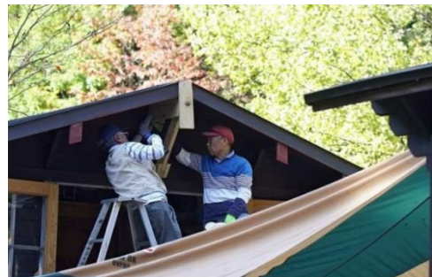
観察小屋正面軒下に雪割板取付け用基台の製作