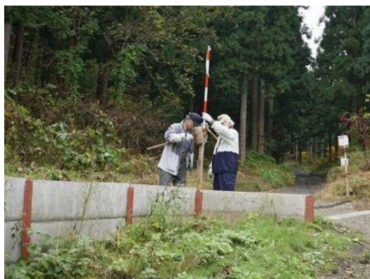
除雪車注意看板取付け