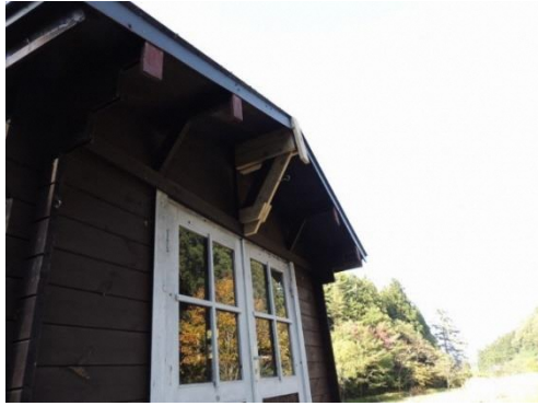
雪割板取付け用正面側軒下基台