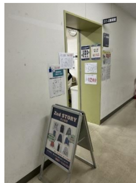
古着販売「セカンドストーリー」 入口