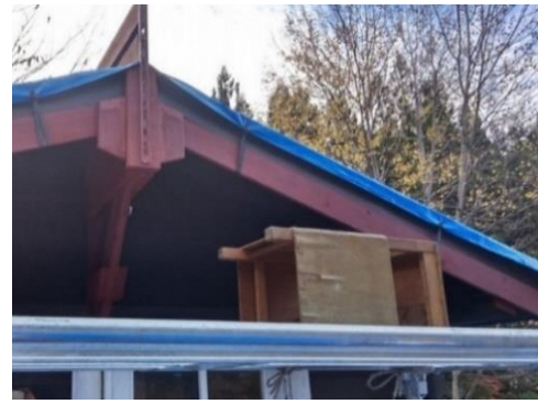
ハトメにゴム輪フックネジ止め