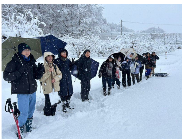
12月22日わどわ先頭はカンジキでラッセル