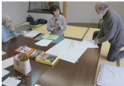
背景デザインの検討