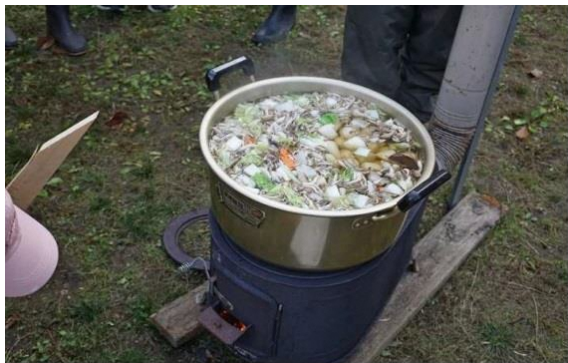
芋煮がおいしく出来ました