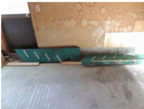
側板にLアンクル取付完了 (10月12日)