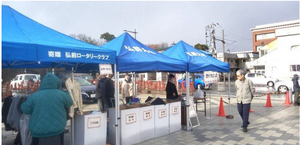
11月30日 古着回収コーナー