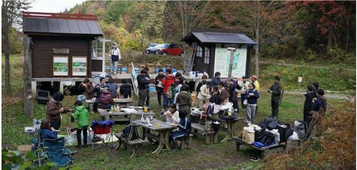
作業納めの秋鍋会（山形芋煮）