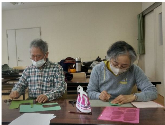
背景用葉っぱの形切り抜き作業