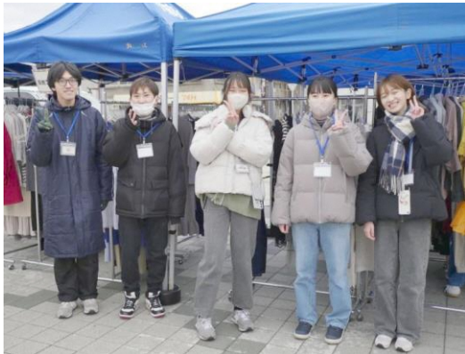
12月1日わどわ部員の皆さん

青森銀行記念館横の弘前市民中央広場にて、衣類ごみを減らすため古着の回収活動並びに、輸出に頼らない古着の地域内循環と地域活性化を目指す活動を実施、古着関係のほか食品屋台・キッチンカー・雑貨など30店舗以上出店