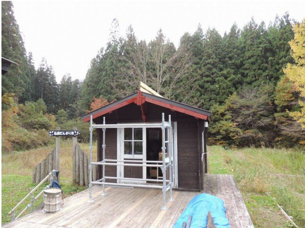
11月1日完成した観察小屋屋根雪割板と仮設枠組み足場