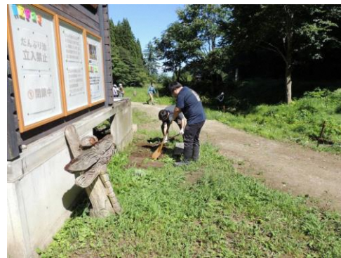
階段の基礎整地作業 (9月1日)