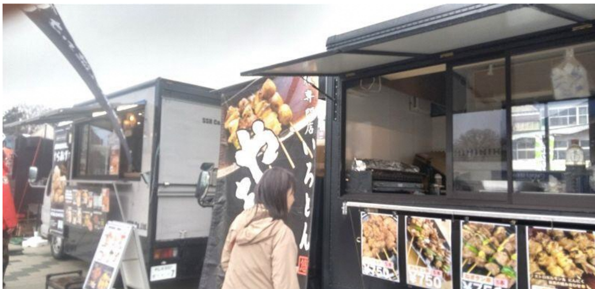
11月30日イベントを盛り上げるため焼き鳥・串焼きなどのキッチンカーも出店