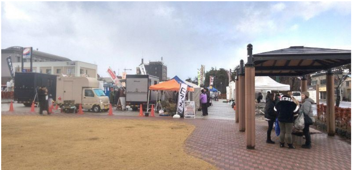
11月30日 市民中央広場会場の様子