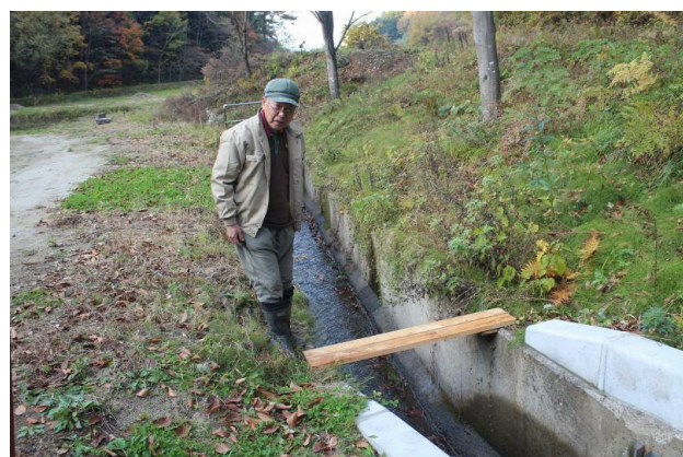
大畑沢簡易渡橋完成