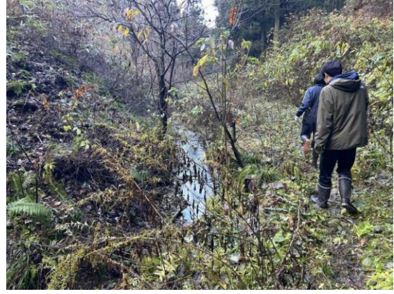
わどわ赤沢上流の観察