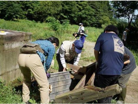
旧階段の撤去作業 (9月1日)