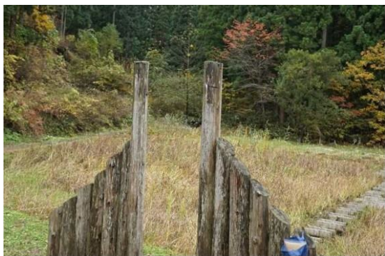
カナコ菴前だんぶり池看板取り外し