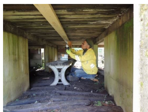
デッキ床板の補強