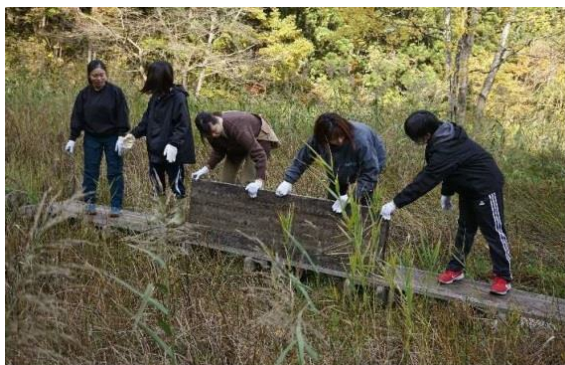
木道天板の取り外し