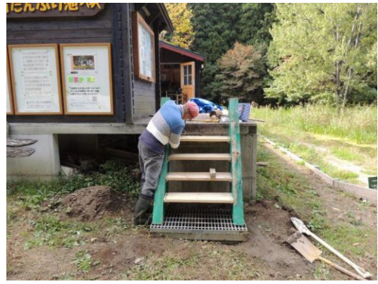
新階段の組立作業