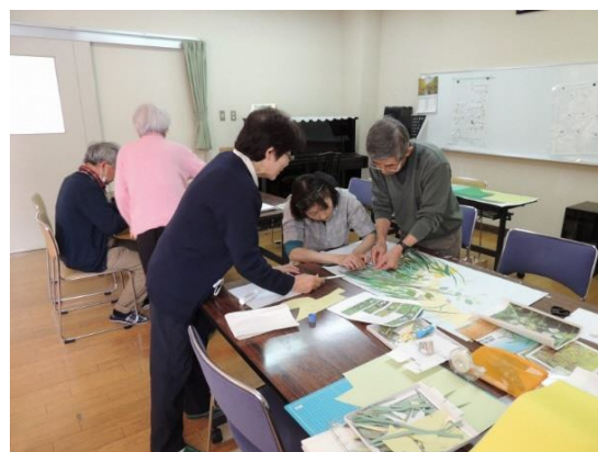
12月20日背景デザインの検討