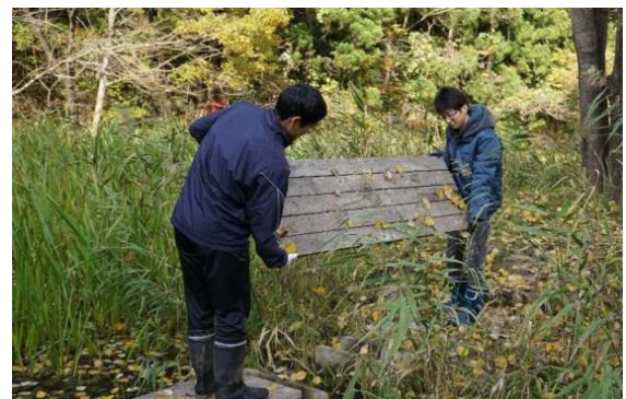
木道天板の取り外し