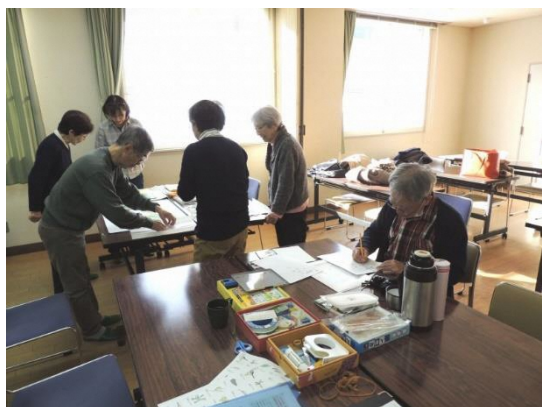
12月20日背景デザインの検討