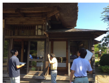
文化財パトロールの様子

国及び県が指定する文化財において修理が必要となった場合は、国の指定文化財は、文化庁と青森県教育委員会の指導の下、県の指定文化財は青森県教育委員会の指導の下、所有者と協議の上で修理計画を作成し、適正な維持のための修理を実施する。建造物については、