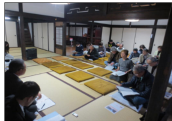
保存計画見直しに係る住民説明会