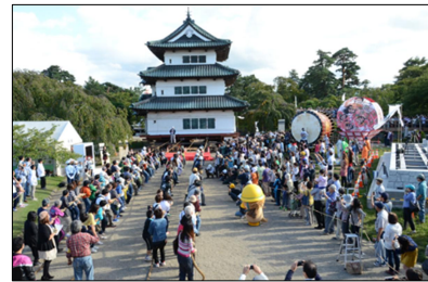
弘前城天守曳家イベント

文化財保護法に規定される周知の埋蔵文化財包蔵地（遺跡）は、現在 459 箇所登録されている。時代は旧石器時代から縄文時代、弥生時代、奈良時代・平安時代・中世・近世にわたり、また、種別も集落跡、城館跡、窯跡、庭園跡など多種多様となっている。城下町である弘前では、今後も近世期の遺跡が発見されることが考えられ、文献資料などの調査を含め試掘・確認調査等の現地調査を行い、遺跡の性格や内容を把握して周知の埋蔵文化財包蔵地として取り扱うことを検討する。遺跡の中で史跡指定を受けているものは、国指定の史跡である津軽氏城跡及び大森勝山遺跡と市指定の史跡である革秀寺境内、吉田松陰来遊の地及び堂ヶ平経塚の 5 件で