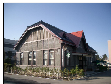
旧第八師団長官舎 (登録有形文化財)

保存修理事業を実施する建造物等は、施工中の一般公開や屋根葺き、土壁塗り、木材の削り方など職人による伝統技法の実演などの公開を推進する。