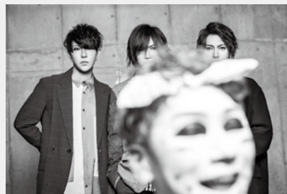
▲ゲストの加藤登紀子さん(左)とゴールデンボンバー(右)

▼とき 11月19日(日)、午前11時50分～午後1時15分(開場は午前11時)