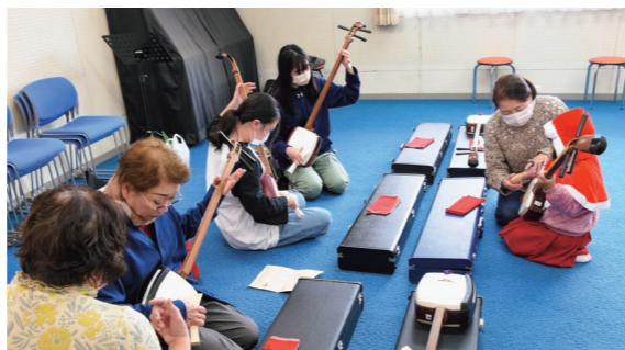
11月25日・26日 岩木文化センターほか（賀田1丁目）

芸 能発表や作品展示、伝統文化体験コーナーなど、岩木地区の文化に触れ合う催しを開催。ふろしき市やミニ四駆・輪投げコーナーなども設けられ、大人も子どもと一緒に楽しんでいました。