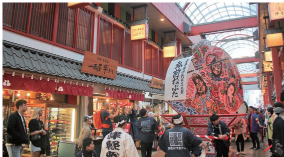
11月17日～19日 浅草寺近辺（東京都台東区浅草）

東 京・浅草でねぶたの運行や物産展などを行い、弘前市の魅力をPRしました。多くの観客が足を止めてカメラを向けたり、一緒に「ヤーヤドー」と掛け声を掛けたりするなど、大盛況でした。