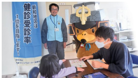
12月2日 新和地区体育文化交流センター（種市字木幡）

新 和地区の健康づくりサポーターや保健師によるベジチェック®のほか、小・中学生の意見発表、楽器演奏、親切カルタ大会など、盛りだくさんの催しに地域の住民が集い、交流していました。