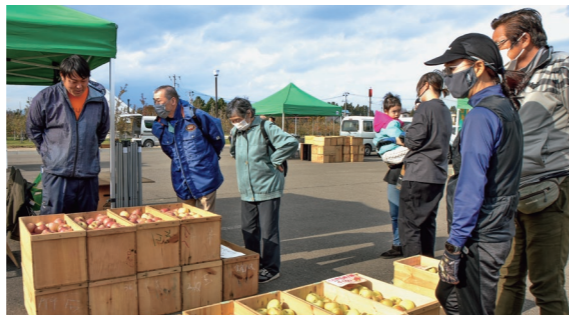
11月23日 りんご公園（清水富田字寺沢）

農 家がりんごや加工品などを持ち寄って、直接販売する市場を開催。旬のりんごが詰まった木箱がずらりと並び、販売者と言葉を交わしながらりんごを買い求める人で活気に満ちていました。