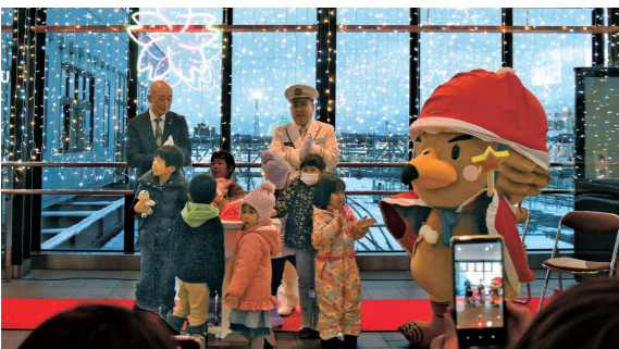
12月1日 あずましろ〜ど（JR弘前駅自由通路2階）

冬 の風物詩であるイルミネーションなどを市内各所で点灯。あずましろ〜どのほか、弘前公園周辺などの街並みに幻想的な光がとまりました。（点灯期間は2月末まで）