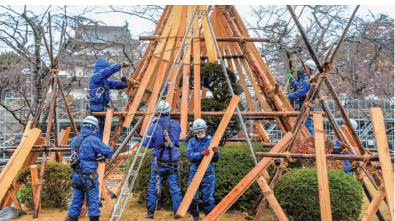
11月24日 弘前公園（下白銀町）

公 園緑地課の職員35人が、園内の樹木約3万本に、くぎを使わず縄で木材を固定する伝統の技で雪囲いや雪吊りを施しました。冷たい小雨がぱらつく中、丁寧に作業を進めていました。