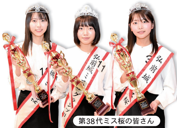
第38代ミス桜の皆さん

▼ 選出方法 一次審査（書類審査）で15人程度を選出し、会場での決勝審査でミス桜グランプリ1人、ミス桜2人を選出します。書類審査の結果は、応募者全員に通知します。 ※ミス桜グランプリには賞金10万円と賞品を、ミス桜には賞金5万円と賞品をそれぞれ贈呈します。