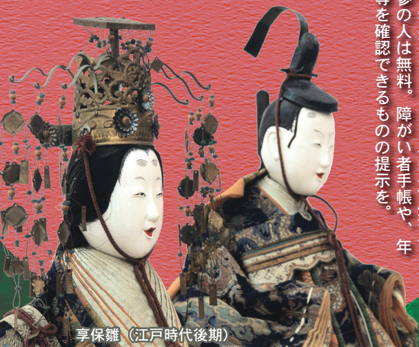
享保雛（江戸時代後期）

子供の健やかな成長と幸せを願う年中行事である、雛祭り・端午の節句にちなんだ資料を紹介します。 ◆第1会場 江戸時代から昭和期までの雛人形や津軽家ゆかりの雛道具の展示 ◆第2会場 勇壮な甲冑（かつちゅう）、五月人形などの展示 ▼観覧料 一般 300円（220円） 高校生・大学生 150円（110円） 小・中学生 100円（50円） ※（ ）内は20人以上の団体料金／障がい者、65歳以上の市民、市内の小・中学生および外国人留学生、ひろさき多子家族応援パスポート持参の人は無料。障がい者手帳や、年齢等を確認できるものの提示を。